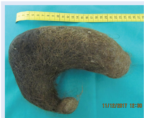
Slika 2. Trihobezoar želuca i početnog dijela duodenuma.

Dlake se nakupljaju u želucu jer nisu podložne razgradnji želučanim enzimima. Zbog svoje glatke površine prilikom djelovanja peristaltike ne giba-