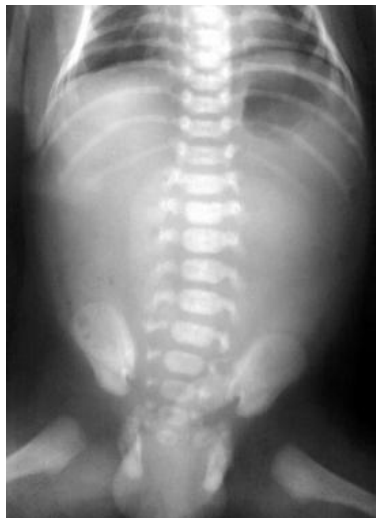
Slika 2. RTG snimka abdomena pokazuje bilateralno masovno uvećane bubrege kod dječaka starog 3 dana s ARPKD-om. (27)

Autosomno recesivna policistična bolest bubrega (ARPKD) najčešća je nasljedna bolest bubrega koja se javlja u dojenačkoj i dječjoj dobi te se još naziva i infantilni oblik PKD-a (slika 2). Razlikuje se od autosomno dominantne policistične bolesti bubrega (ADPKD), koja se obično javlja kod starije populacije. Klinički spektar pokazuje veliku varijabilnost, u rasponu od perinatalne smrti do blažeg progresivnog oblika, koji se možda neće dijagnosticirati do adolescencije.(27) Incidencija ARPKD-a je 1 na 20 000 živorođene djece. ARPKD također ima značajne učinke na ostale organske sustave. Pacijenti mogu imati Carolijev sindrom koji se sastoji od proširenih žučnih kanala, kongenitalne jetrene fibroze (CHF) i portalne hipertenzije (PH). Djeca s ARPKD također mogu biti izložena i riziku od neurokognitivne disfunkcije.(28)