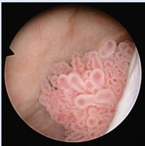
Slika 2. Cistoskopski prikaz tumora mokraćnoga mjehura. Slučajni nalaz papilarnog tumora na prednjoj stijenci mokraćnoga mjehura otkriven prilikom postavljanja JJ endoproteze.

urednog nalaza. Otpuštena je na kućno liječenje uz imunosupresivnu terapiju: takrolimus, mikofenolat-mofetil i kortikosteroid. Mjesec dana po operaciji pacijentici je odstranjena ureteralna endoproteza.