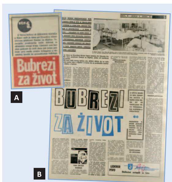
Slika 6. Novi list je na sam dan transplantacije na naslovnici najavio prvu transplantaciju bubrega (A) uz članak na petoj stranici (B).

1. Želja profesora Frančiškovića bila je da se prva transplantacija izvede u miru, bez znanja javnosti. Zamolio je novinarku Novog lista, koja je vodila zdravstvenu rubriku, da o događaju piše tek nakon što se odigra. Problem je bila činjenica da Novi list nije izlazio nedjeljom. Posljedica bi bila da vijest objave ostali listovi ranije od lokalnog glasila. Rezultat toga bio je da je u subotnjem No-