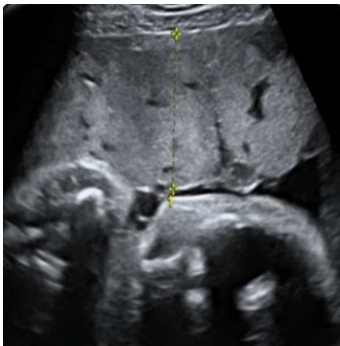
Slika 2. Ultrazvučni prikaz zadebljanje posteljice (1).

Sistemna fetalna infekcija zatim može zahvatiti brojne organe i prezentirati se različitim abnormalnostima ultrazvučnog nalaza, od hepatosplenomegalije, kardiomiopatije, kalcifikacijama brojnih organa te rjeđe fetalnim hidropsom. Kolestatski hepatitis i insuficijencija jetre rezultiraju ascitesom, a u kombinaciji s anemijom mogu dovesti do fetalnog hidropsa. Kardiomiopatija se očituje kardiomegalijom s hiperehogenim miokardom u kombinaciji s perikardijalnim ili pleuralnim izljevom (32).