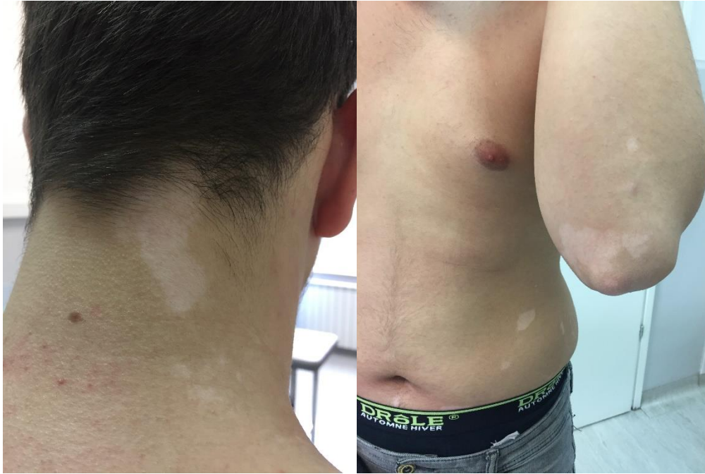
Slika 2. Vitiligo u djece