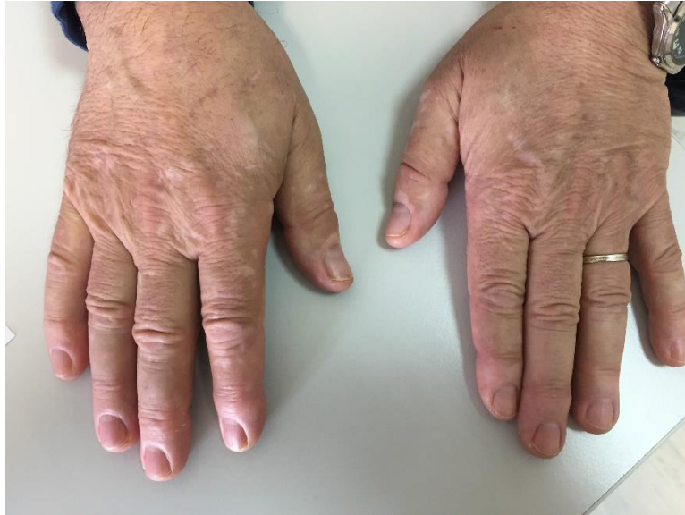
Slika 1. Vitiligo u odraslih