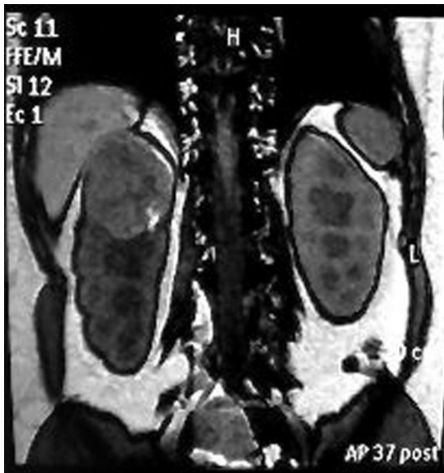
Slika 2. Prijeoperacijski MRI trudnice sa tumorom desnog bubrega (42).