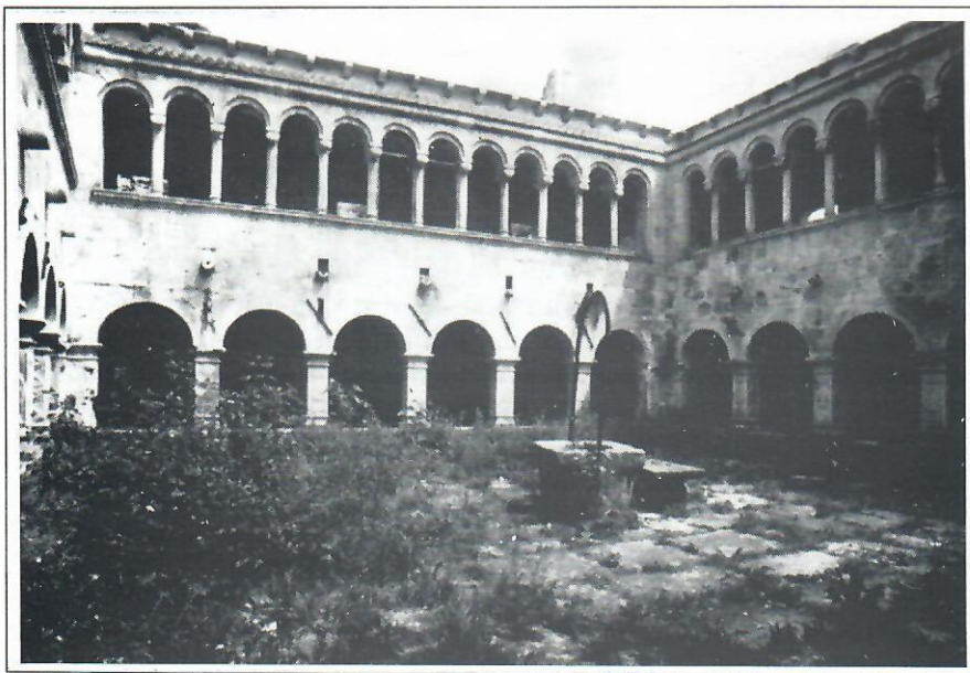
SLIKA 3. Dvorište pavlinskog samostana u Sv. Petru u Šumi FIGURE 3 The court of the Paulist monastery of Sv. Petar u Šumi