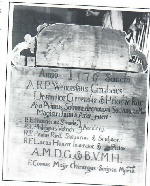
SLIKA 2. Zapis s tabernakula na glavnom oltaru župne crkve Blažena Djevica Marije u Crikvenici