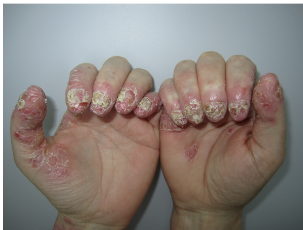
Slika 2. Acrodermatitis continua suppurativa Hallopeau

psorijaze karakteriziran kroničnim izbijanjem sterilnih seroznih pustula u predjelu distalnih falangi. Bolest obično počinje na jednom prstu ruke nakon traume. Nokat zahvaćenog prsta često je promjenjen u smislu onihodistrofije i oniholize (Slika 2)(5,6,9).