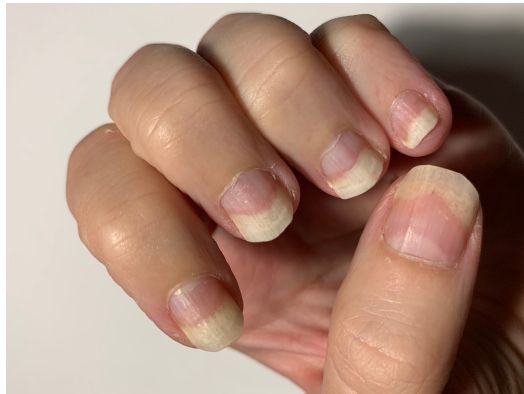
Slika 3. Psorijaza noktiju

Na zahvaćenim noktima vide se punktiformne udubine ( psoriasis punctata unguium ), žućkaste mrlje, oniholiza, a nokti su zadebljani, namreškani i lomljivi. Osim noktiju, često je zahvaćena i koža zaslona nokta ( paronychia psoriatica ). Oniholiza nastaje odvajanjem nokta od ležišta koje je zahvaćeno psorijazom. Nokt se odvaja na nepravilan način, te ploča požuti uz vidljiva područja "uljnih mrlja" i stvaranje subungualnog debrisa (Slika 3)(17, 18).