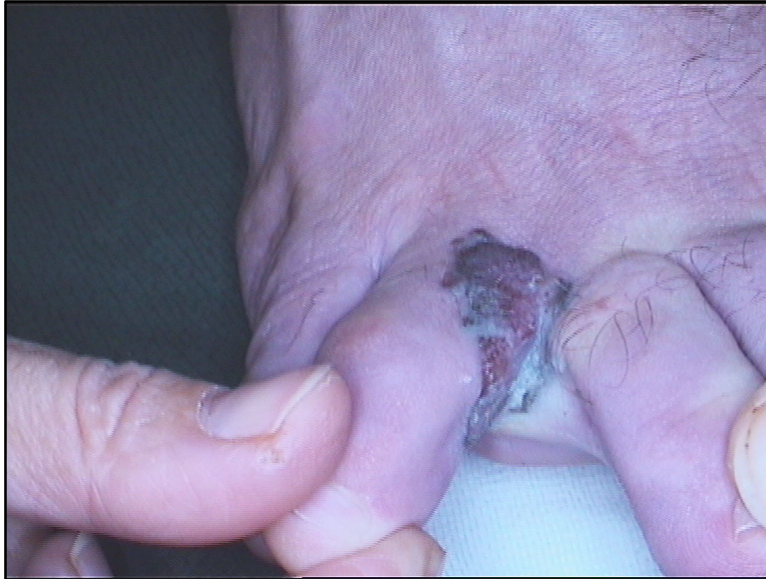
Slika 3. Akrolentiginozni maligni melanom