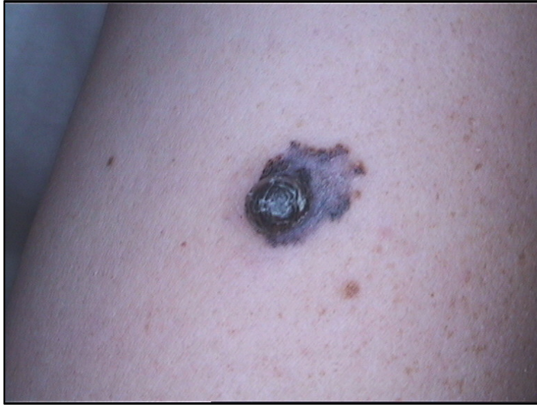
Slika 2. Nodularni melanom