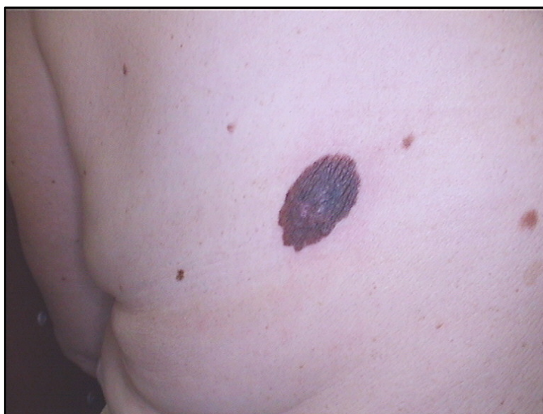
Slika 1. Površinsko šireći melanom

U horizontalnoj fazi rasta površinsko šireći melanom izgleda poput smeđe-crne makule ili blago uzdignutog plaka promjera do 1 cm, nepravilnih, nazubljenih rubova i nejednolične pigmentacije (sl.1.) (8).