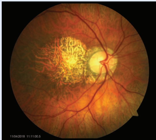
Slika 1. Geografska atrofija – fundus fotografija u boji