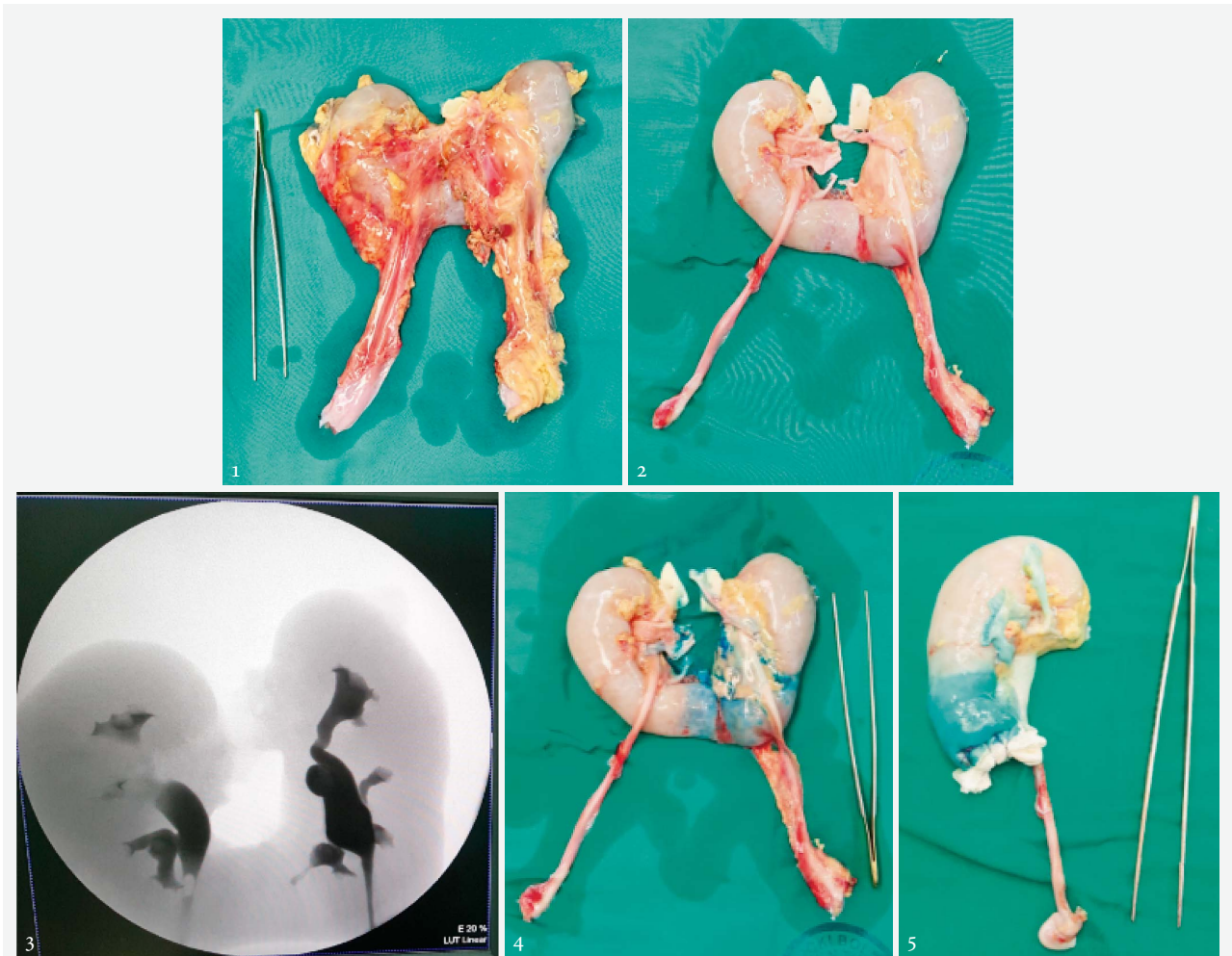
SLIKA 1. POTKOVIČASTI BUBREG EKSPANTIRAN EN BLOC

FIGURE 1. EN-BLOC EXPLANTED HORSESHOE KIDNEY