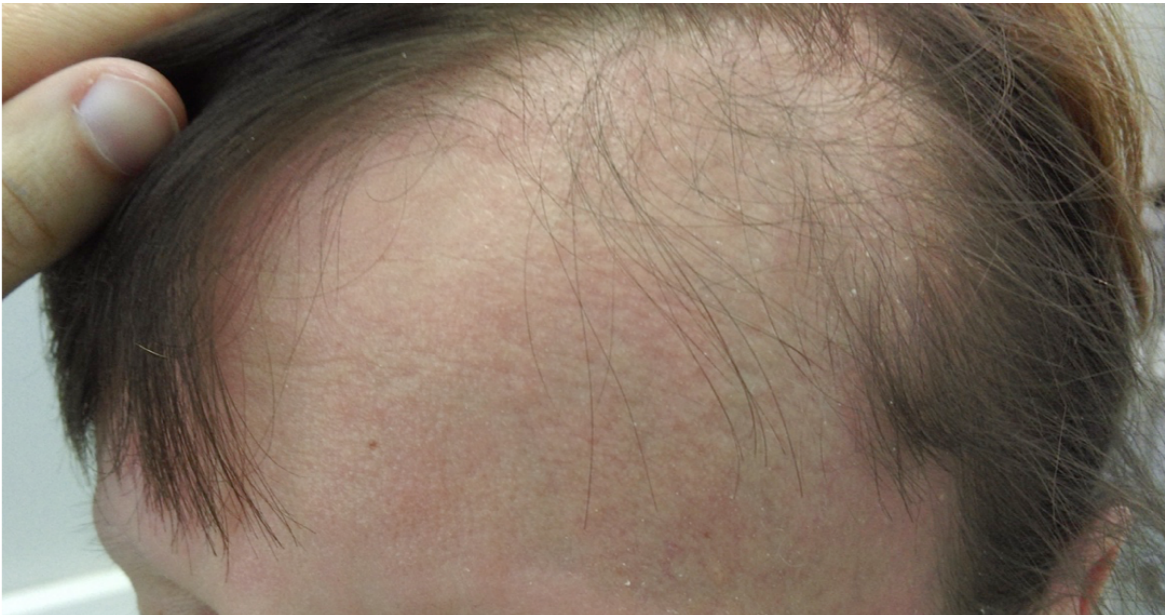
Slika 6. Alopecija uzrokovana vemurafenibom