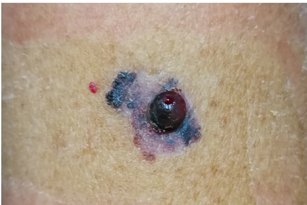
Slika 2. Površinsko šireći melanom s nodularnom komponentom