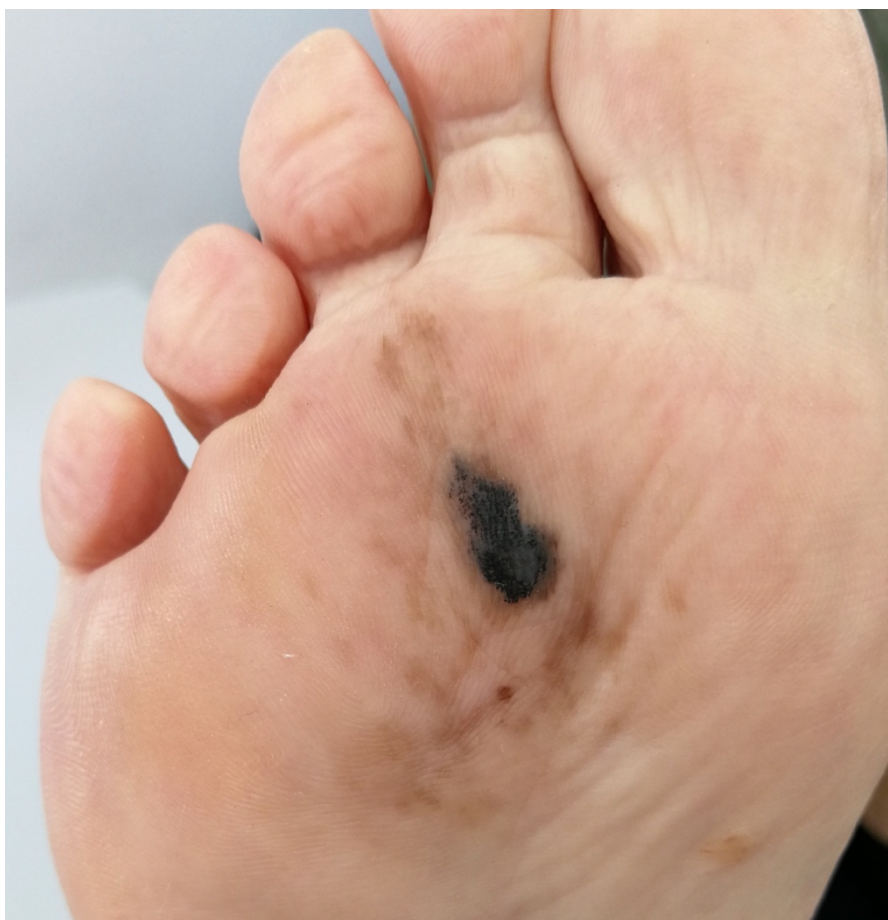
Slika 4. Akrolentiginozni melanom

Akrolentiginozni melanom najrjeđi je tip melanoma i čini manje manje od 5% svih melanoma. Predstavlja zapravo najčešći oblik melanoma u osoba afričkog i japanskog podrijetla. Tipično se pojavljuje u muškaraca između 60 i 70 godina. Nastaje na dlanovima, stopalima i subungvalnim površinama. U početku ima izgled smeđe, nepravilno pigmentirane makule koja se postepeno razvija u nodularnu leziju. Subungvalni tip obilježava longitudinalna smeđecrna linija na nokatnoj ploči koja postupeno dovodi do destrukcije nokta uz nastanak ulceracije i krvarenja [1,10,21].