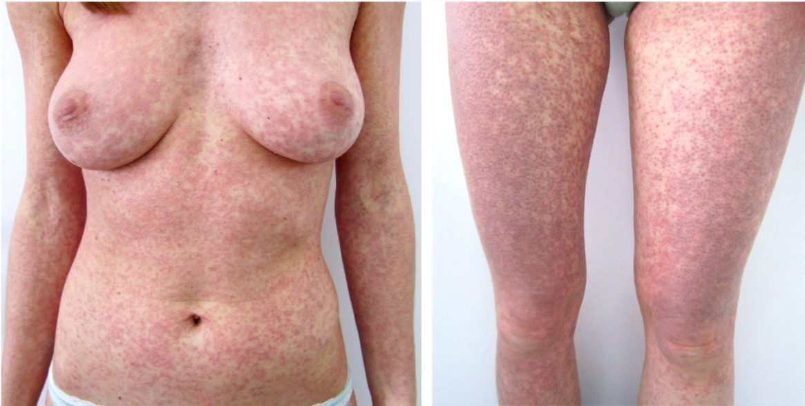
Slika 5. Makulopapulozni osip uzrokovan vemurafenibom

Najčešće nuspojave primjene BRAF inhibitora su dermatološke komplikacije poput makulopapuloznog osipa, fotosenzitivnosti, hiperkeratoze i alopecije (Slika 5, 6).