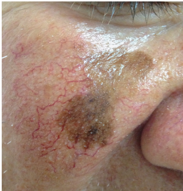
Slika 3. Lentigo maligni melanom

Lentigo maligni melanom čini 5-15% svih tipova melanoma za čiji je nastanak ključan kumulativan učinak ultraljubičastog zračenja. Pojavljuje se gotovo isključivo u osoba starijih od 65 godina na koži glave i vrata koja je kronično oštećena suncem. Lentigo maligni melanom prezentira se kao hiperpigmentacija, odnosno smeđa, nejednoliko pigmentirana makula koja je godinama u horizontalnoj fazi rasta (Slika 3). Promjena se postepeno povećava, kada se opaža izdignuta, crna papula ili čvor, što ukazuje na vertikalnu fazu rasta tumora [1,10,21].