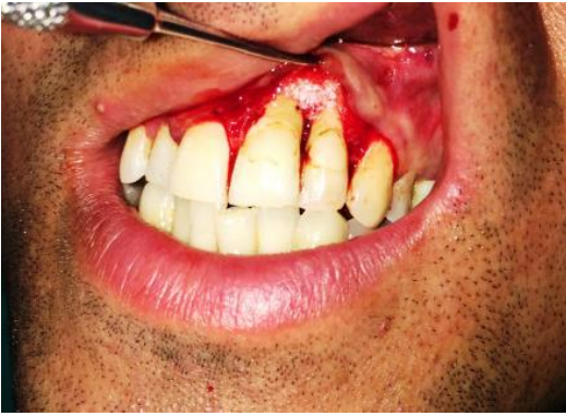
Slika 4. Defekt ispunjen hijaluronskom kiselinom (HYADENT BG BioScience GmbH Ransbach-Baumbach, Njemačka) i nadomjesnim koštanim materijalom ( Bio-Oss, Geistlich Pharma AG, Wolhouse Švicarska).