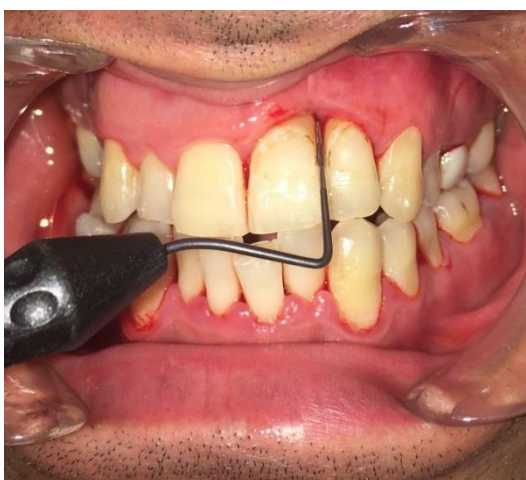
Slika 8. Klinička situacija šest mjeseci nakon operativnog zahvata. PPD 21 distalno iznosi 2 mm.