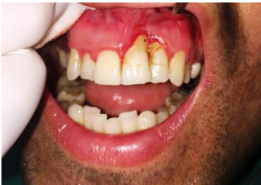
Slika 3. Infrakoštani defekt između zuba 21 i 22 uz recesiju gingive.

Nakon inicijalne parodontne terapije 33-godišnjem pacijentu zaostao je intrakoštani defekt između zuba 21 i 22 uz recesiju gingive (Slika 3). Kako su zubi 21 i 22 bili i pomični (stupanj 1), prije kirurškog zahvata su šinirani. Defektu se pristupilo tehnikom jednostranog reznja s vestibularne strane. Defekt je ispunjen hijaluronskom kiselinom (HYADENT BG BioScience GmbH Ransbach-Baumbach, Njemačka) i nadomjesnim koštanim materijalom (Bio-Oss, Geistlich Pharma AG, Wolhouse Švicarska) (Slika 4) preko kojega je postavljen slobodni vezivni transplantat (Slika 5), a režanj je koronarno pomaknut (Slika 6). Nakon operacije, pacijent je naručivan redovito svaka dva mjeseca na uklanjanje zubnih naslaga. Nakon dva mjeseca uklonjen je splint. Zubi više nisu bili pomični. Klinički rezultati evaluirani su nakon šest mjeseci (Slike 7 i 8 i Tablica 1). Prema kliničkoj slici i izmjerenim parodontnim indeksima može se zaključiti kako je došlo do poboljšanja – zubi više nisu pomični, parodontni džepovi kao i gingivna recesija su smanjeni. Naravno, nije se uspjelo regenerirati interdentalnu papilu jer je to, za sada još uvijek nemoguće.