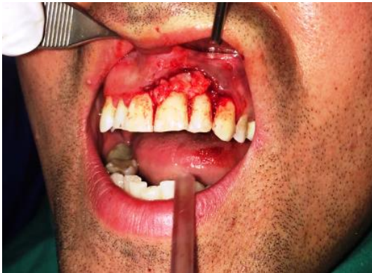
Slika 5. Postavljanje slobodnog gingivnog transplantata preko ispunjenog defekta.