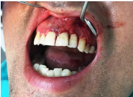
Slika 6. Koronalno pomaknuti režanj