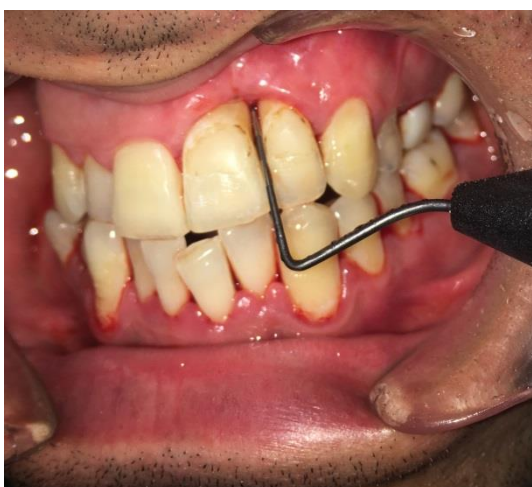
Slika 7. Klinička situacija šest mjeseci nakon operativnog zahvata. PPD 22 mezijalno iznosi 2 mm.