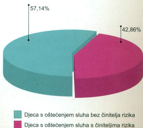
Slika 2. Završni rezultati probira sluha u novorođenčadi s obzirom na činitelje rizika Figure 2 Final results of hearing screening in high-risk newborns

Oštećenje sluha je 10–15 puta češće u skupini novorođenčadi s činiteljima rizika.