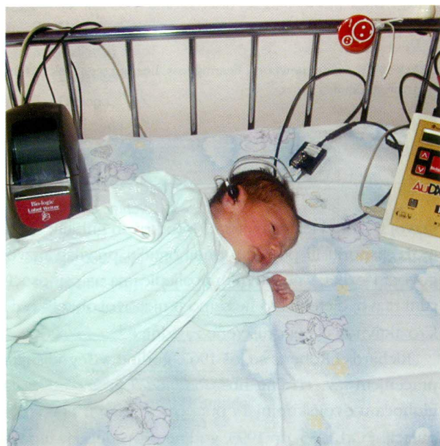
Tablica 1. Činitelji rizika za oštećenje sluha

Ispitana su živorođena novorođenčad rođena u Klinici za ginekologiju i porodništvo KBC-a Rijeka.