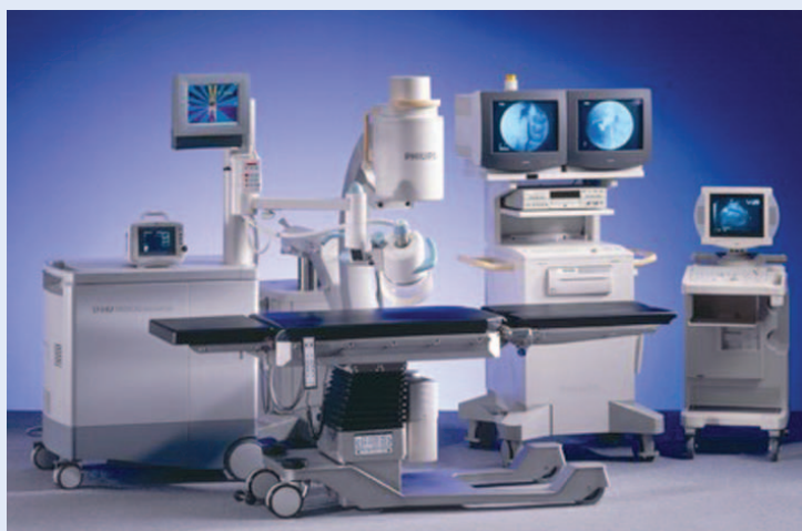
Slika 1. Suvremeni aparat za izvantjelesno mrvljenje kamenaca pod dijaskopskom i ultrazvučnom kontrolom

Tri suvremene, minimalno invazivne metode dovele su do značajnijeg smanjenja morbiditeta kod kirurškog liječenja urolitijaze 2 . To su perkutana nefrolitotripsija (PNL), rigidna i fleksibilna ureteroskopija (URS) i izvantjelesno mrvljenje kamenaca (ESWL; engl. extracorporeal shock wave lithotripsy ). Ove metode imaju podjednaku efikasnost kao i otvoreni kirurški zahvat, ali je morbiditet daleko manji te su u današnje vrijeme postale okosnica liječenja urolitijaze.