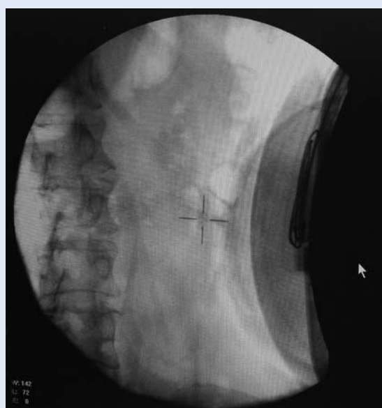
Slika 3. Jedinica za prikaz i lokalizaciju kamenca pod kontrolom dijaskopije. Vidljiv je kamenac koji je „naciljan“ u sredini meće.

moćnosti vizualizacije bubrežnih i kamenaca u mokraćovodu, boljeg praćenja dezintegracije kamenca, a nedostatak u zračenju pacijenata i nemogućnosti lokalizacije manjih i radiolucentnih kamenaca. Prednost ultrasonografije je u mogućnosti vizualizacije radiopaknih i radiolucentnih kamenaca pomoću „žive slike“ uz odsutnost zra-