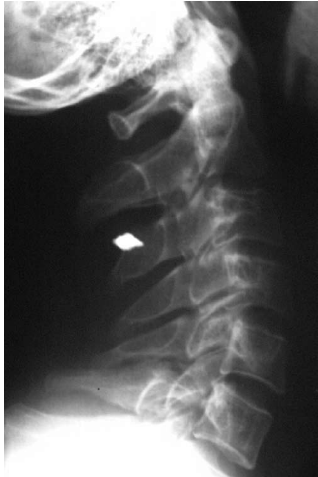
Slika 1. Radiološka obrada tri tjedna nakon ozljede glave: gore je rtg snimka vrata koja pokazuje šrapnel granate, dolje je CT koji pokazuje područje hipodenziteta u lijevom trigonumu.

Opisi oligodendroglioma koji su bili primarno dijagnosticirani kao post-traumatske promjene nestaju početkom sedamdesetih godina prošlog stoljeća nakon uvođenja CT i MRI pretraga. Tako je pojava "patološke reakcije na oštećenje mozga" izgubila na značajnosti. Usprkos tome, značajan broj bolesnika još uvijek živi u područjima gdje moderne i skupe tehnike ispitivanja mozga nisu uvijek dostupne. Na prvom CT skenu koji je učinjen u cilju dijagnoze ozljede glave, oligodendrogliom je nađen slučajno. Ispravna rana dijagnoza nije postavljena jer su simptomi opisani kao post-traumatski sindrom.