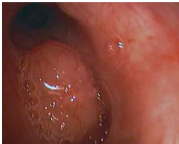
Slika 2. Bronhoskopija pokazuje ulaz u lijevi B1 + 2 bronh zatvoren tumorom

Picture 1 MSCT findings of polycyclic, solid expansion in the central part of the upper lobe of the left lung (arrow), included with hypodense areas which correspond to the liquid