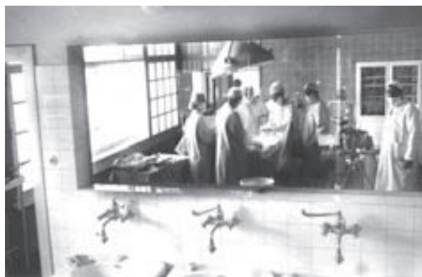
Slika 5. Urološka dvorana u sušačkoj bolnici, 1950. Figure 5 The urology theatre at Sušak hospital, 1950

Od 1959. do 1961. voditelj odjela je prim. dr. Viktor Juzbašić (odlazi u inozemstvo), a nakon njega odjel vodi