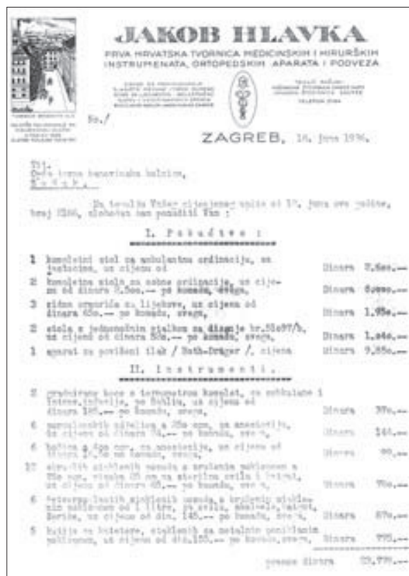
Slika 3. Prva narudžba kirurških instrumenata od 16. lipnja 1936. na "JAKOB HLAVKA – Prva hrvatska tvornica medicinskih i hirurških instrumenata, ortopedskih aparata i podveza" iz Zagreba

Iz toga jedinog i vrlo vrijednoga, nama dostupnoga pisanog traga, vidi se da je prim.dr. Janko Komljenović bio zasigurno prvi na Sušaku koji je uveo endoskopsku urologiju . U toj je narudžbi jasno zapisano da su uporabljivali standardnu cistoskopiju ("cystoskop za pregled broj 10 Examiner"), litotripsiju ("Lithotriptor kompletan po Reliquet-u" i "Lithotriptor Kystoskopski po Dr. Canny Ryall") i endovezikalne operacije ("Cystoskop kompletan za endovesikalne operacije po prof. dr. Joseph-u, Operation").