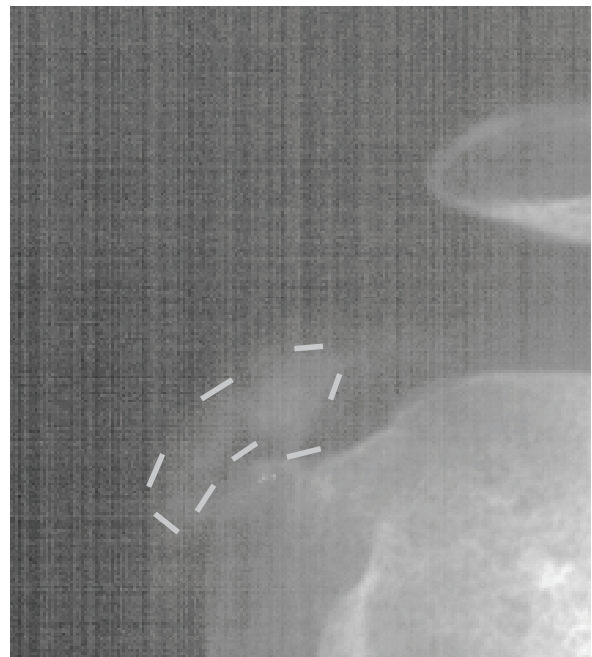
Slika 1. Rendgenski prikaz kalcifikata u tetivi m. supraspinatusa Figure 1. The x-ray of the shoulder demonstrates calcifying deposition in the suprapinatus tendon

Klasični rendgen je metoda koja se najčešće upotrebljava u dijagnostici kalcificirajućeg tendinitisa. Pri sumnji na to, potrebno je inicijalno učiniti AP snimke ramena u neutralnoj, unutarnjoj i vanjskoj rotaciji. Kalcifikat u tetivi supraspinatusa vidljiv je u neutralnoj rotaciji, u tetivi infraspinatusa i tetivi teres minora u unutarnjoj rotaciji, a u tetivi supraspinatusa u vanjskoj. Buduće praćenje iziskuje samo jednu poziciju 4 (slika 1.). Aksilarna i skapularna projekcija rijetko se primjenjuju. Na rendgenskim snimkama procjenjujemo lokalizaciju, veličinu, ograničenost i gustoću kalcifikata. Serija snimaka može jasno pokazati razvoj bolesti po fazama. 12 Tijekom formativne ili kronične faze depozit je jasno vidljiv i ograničen i jednakomjerne je gustoće. Tijekom resorptivne ili akutne faze depozit je magličast, nejasno ograničen,