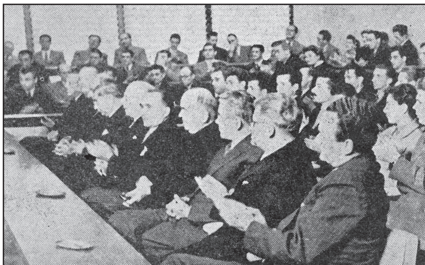
Slika 2. Dvorana za sjednice Kotarskog narodnog odbora Rijeka, 21. studenoga 1955. Svečano otvaranje Medicinskog fakulteta (Novi list, 22. XI. 1955.)

Figure 2 Inauguration of the Rijeka School of Medicine at the People's District Council Hall on 21 November 1955 (Novi list, 22 November 1955)