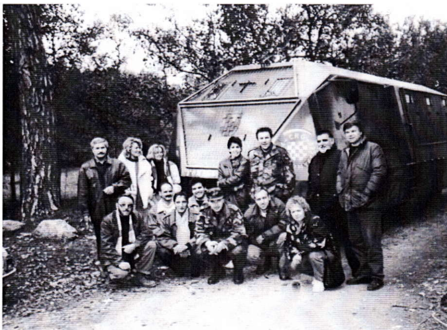
Sl. 3. Klanac, 28. listopada 1991. Mobilne ekipe opće medicine Doma zdravlja Rijeka. Fig. 3. Klanac, October 28, 1991. Mobile medical teams of the Rijeka Health Center.

Uvažavajući ranije spomenuta osnovna organizaciono usmjeravajući pristupna načela kao i potrebu brzog udovoljavanja efikasnom i dostupnom zdravstvenom zaštitom u ratnom području, bilo je omogućeno tek blagovremenim osnivanjem glavnog organizacijskog okvira na razini ratnih općina, tj. Štaba saniteta Općine Rijeka pod koordinaciju Kriznog štaba regije. Značenje Sanitetskog štaba leži u činjenici što se je posredstvom njega neposrednije ostvarivala tijesna suradnja prvenstveno između zdravstvenih ustanovama u Rijeci i šire, a potom sa Općinskim tijelima uprave za poslove zdravstva, sa zdravstvu srodnim i bliskim udruženjima i postrojbama: Općinskom organizacijom Crvenog križa Hrvatske, Općinskim štabom civilne zaštite, zdravstvenom službom MUP-a, Službom izviđanja i obavještanja, humanitarnim i karitativnim organizacijama, bez kojih zdravstvena služba u složenim uvjetima rada, opterećena nepovoljnim okolnostima, gotovo da ne bi mogla adekvatno funkcionirati. Osnivanjem štaba saniteta u Rijeci, uspostavljena je nadasve značajna vertikalna povezanost zajedno sa Glav-