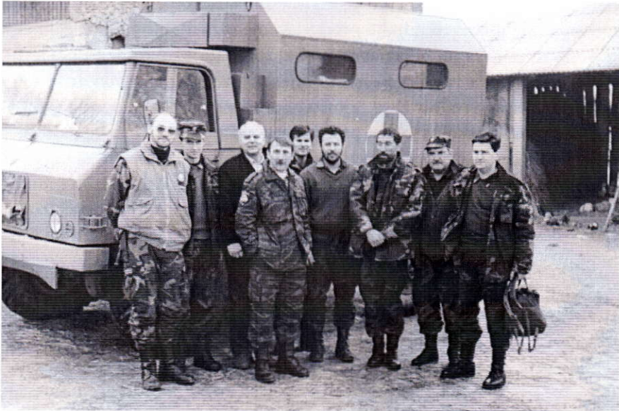
Sl. 5. Bilaj, 7. siječnja 1992. Smjena sanitetskih ekipa sanitetske postaje bojne Fig 5. Bilaj, January 7, 1992. The change of medical teams of the Battalion Medical Station.

re prve pomoći i općemedicinske zaštite svima onima kojima je ta pomoć bila najpotrebnija.