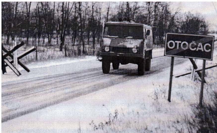
Sl. 4. Otočac, 2. prosinca 1991. Povratak sanitetske ekipe s linije bojišnice Fig.4. Otočac. December 2, 1991. Coming back of a medical team from the fire line.

Obzirom da se S osnova uvjeta rada, frekvencije obolijevanja i drugog, znatno uvećava radno opterećenje postojećeg zdravstvenog osoblja na prvim linijama bojišta, od 12. listopada 1991. godine na te se zadatke bez prethodnog uvjeravanja, otvoreno angažiraju dobrovoljačke sanitetske ekipe Doma zdravlja Rijeka, a tek početkom 1993. godine, mobilizirani liječnički kadar.