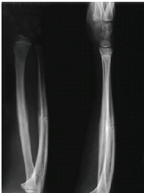
Slika 3. Rendgenske slike saniranog prijeloma u bolesnika čije su preoperativne i rane postoperativne slike prikazane na slici 2. Figure 3 X-ray pictures of the healed fractures in patients whose preoperative and early postoperative pictures are shown in Figure 2

Prvih poslijeoperacijskih dana započeto je opterećenje ili uporaba ozlijeđenog ekstremiteta tako da nije bilo potrebno nikakvo fizijatrijsko liječenje. Sav potrebn postupak fizijatra s ovim bolesnicima sastojao se u tome da im se pokaže uporaba potpazušnih ili podlaktičnih štaka u početku uporabe ozlijeđenoga donjeg ekstremiteta, kako bi se bolesnik ohrabrio i bez straha se služio nogom i oslanjao se na nju. Jedan se naš bolesnik odmah nakon izlaska iz bolnice, tj. četvrtog dana nakon osteosinteze radiusa i ulne, počeo potpuno slobodno služiti ozlijeđenom rukom u pisanju školske zadaće. Rendgenske slike učinjene nakon prijeloma i odmah nakon uvođenja Prévot-Nancyjeva čavla prikazuje slika 2., a slika 3. prikazuje rendgenske slike konsolidiranih prijeloma dvojice naših bolesnika, učinjene neposredno prije uklanjanja čavala, a u jednog odmah nakon uklanjanja. Vidi se idealan položaj sraslih ulomaka, tj. idealna anatomska restitucija prelomljene kosti.