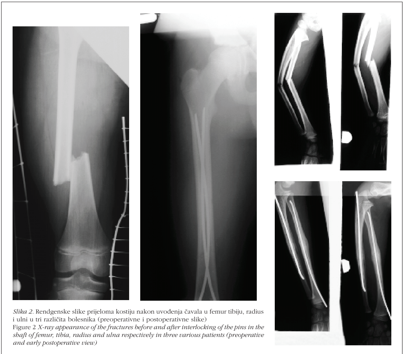
Slika 2. Rendgenske slike prijeloma kostiju nakon uvođenja čavala u femur tibiju, radius i ulni u tri različita bolesnika (preoperativne i postoperativne slike) Figure 2 X-ray appearance of the fractures before and after interlocking of the pins in the shaft of femur, tibia, radius and ulna respectively in three various patients (preoperative and early postoperative view)

uvodi preko mjesta prijeloma u drugi ulomak, gdje ga se naprosto ukotvi u spongiozi. Tako postavljen čavao, nakon stavljanja plastične kapice na okrajak, podvuče se pod kožu, a otvor na koži se zatvori šavom (vidi sl. 1.). Slika 1. shematski prikazuje način uvođenja Prévot-Nancyjeva čavla u prelomljenu kost, mjesto uvođenja čavla i njegov konačni položaj u kosti. Slika 2. prikazuje rendgenske slike prelomljenih kostiju prije i nakon uvođenja čavala u medularni kanal u trojice naših bolesnika. Čavli se uobičajeno uvode u medularni kanal prelomljenog femura u područje distalne metafize medijalno i lateralno, kod radiusa se uvodi jedan čavao kroz medijalnu ploštinu distalne, a ulne kroz stražnju ploštinu proksimalne metafize. U humerus se u području distalne trećine lateralno uvode oba čavla, a u tibiju oba kroz proksimalnu metafizu.