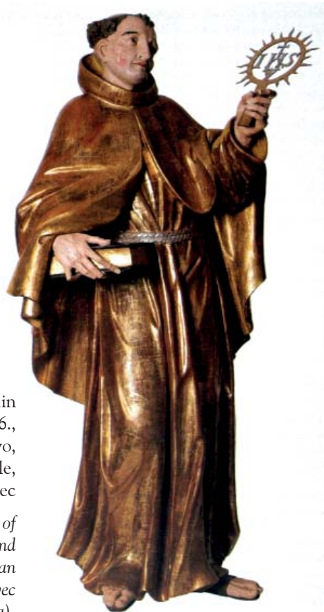
Fra Pavao Reble: Sv. Bernardin Sijenski, oko 1736., polikromirano i pozlaćeno drvo, franjevačka crkva Sv. Nikole, Čakovec

Fra Pavao Reble: St. Bernardine of Sienna, around 1736; gilded and polychromated wood. Franciscan church of St. Nicholas, Čakovec (Croatia).