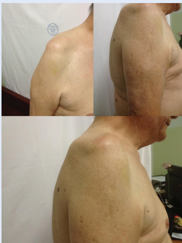
Slika 1. Prikaz pacijenta s najizraženijim hipotrofičkim promjenama desne nadlaktice i ramenog pojasa.

Kod postavljanja dijagnoze flail-arm sindroma treba razmišljati o primarnoj mišićnoj atrofiji, spinalnoj mišićnoj atrofiji, monomeličnoj amiotrofiji, multifokalnoj motornoj neuropatiji, post-polio sindromu, bolestima vratnog segmenta kralježnične moždine i spinalnih živaca te brahijalnog pleksusa.