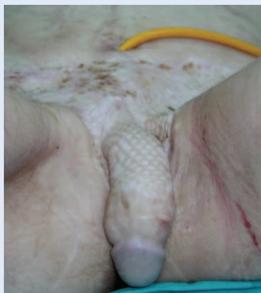
Slika 3. Stanje po završetku liječenja. Figure 3 Definitive state.

mortalitet bolesnika s Fournierovom gangrenom vrlo visok. Interval od pojave kliničkih simptoma do početka kirurškog liječenja najvažniji je prognostički čimbenik 2,5 . S obzirom na značajno vi-