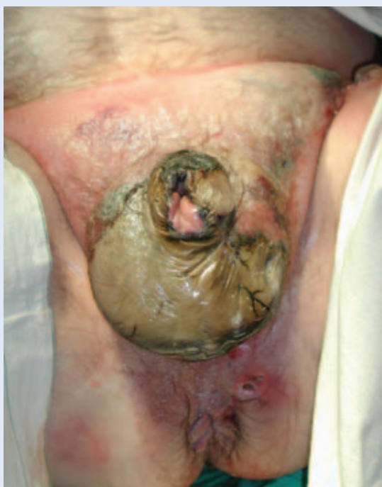
Slika 1. Bolesnik na operacijskom stolu. Vidljiva je uznapredovala nekroza genitalne, suprapubične regije i područja unutarnjih strana bedara.

Bolesnik je hitno prijeoperacijski pripremljen te je učinjen hitan kirurški zahvat. Učinjena je opsežna ekscizija nekrotičnih masa penisa, skrotuma, suprapubične regije, perinealne i obje ingvinalne regije. Uklonjeno je sve nekrotično tkivo do