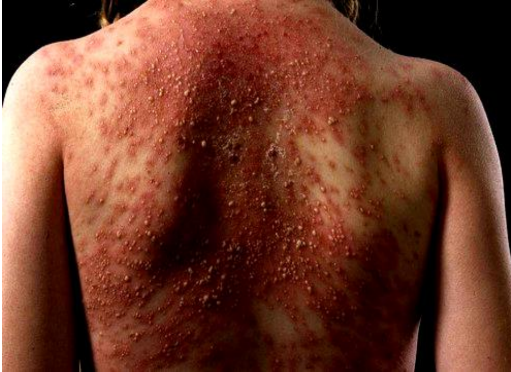
Slika 8. Akutna generalizirana egzantematozna pustuloza. Vidljive su brojne male pustule na eritematoznoj podlozi.