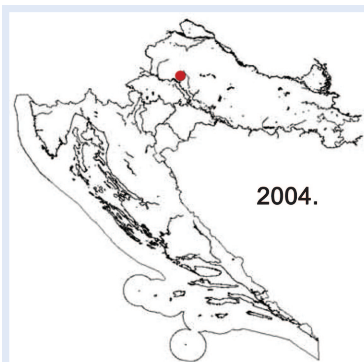
Slika 2. Rasprostranjenost komarca Aedes albopictus u Hrvatskoj 2004. godine 5

Hrvatska je sve poželjnija destinacija za turiste, a s turistima putuju i virusi. Na probleme koje može stvoriti virus dengue u Hrvatskoj, potaknula su nas dva importirana slučaja denga groznice tije-kom ljeta 2007. U prvom slučaju radilo se o špa-njolskoj novinarki iz Barcelone koja je doputovala 3. kolovoza 2007. u Dubrovnik, a prije toga bora-vila u endemskim područjima Indije 1,9 . Drugi im-portirani slučaj denga groznice je slučaj hrvatske