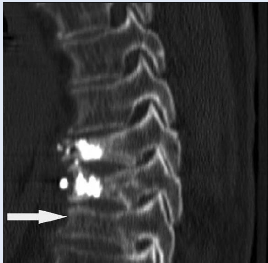
Slika 3. Sagitalna CT-rekonstrukcija pokazuje ranije tretirane osteoporotične frakture Th 9 i Th 10 kralješka i novu frakturu Th11 kralješka.

Figure 3 Sagittal MSCT reconstruction show earlier osteoporotic vertebral body fractures at Th9 and Th10 and new one on Th 11