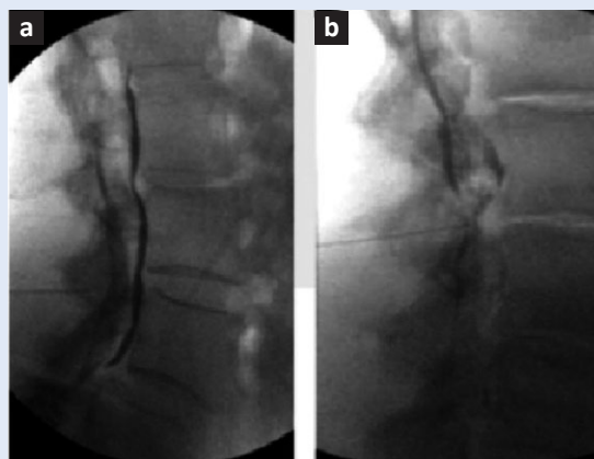
Slika 3. Primjena lokalnog anestetika za bol u stražnjem dijelu vratne kralježnice koji nema specifičnu radikularnu komponentu

Figure 2 Injection of local anesthetics for pain caused by chronic frontal, paranasal and maxillary sinusitis, and for mild trigeminal neuralgia