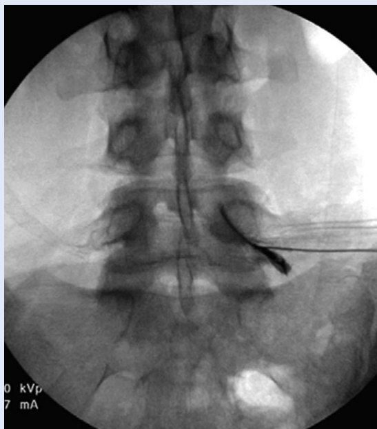
Slika 5. Injiciranje lokalnog anestetika u kroničnom gastritisu, iritaciji duodenuma, refluksnoj bolesti i spazmima pilorusa

Figure 5 Injection of local anesthetic in chronic gastritis, duodenal irritation, reflux disease and by pylorus spasms