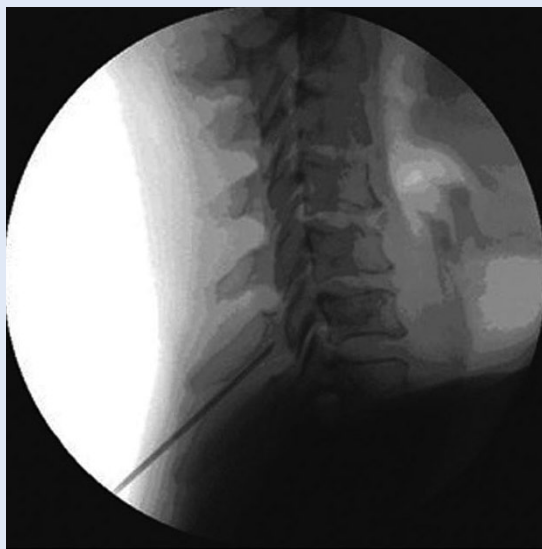
Slika 2. Injiciranje lokalnog anestetika kod bolova uzrokovanih kroničnim upalama frontalnih, paranasalnih i maksilarnih sinusa, te blažih oblika trigeminus neuralgije

Po ulasku u epiduralni prostor slijedi radiološka provjera kontrastom te ubrizgavanje lijeka.