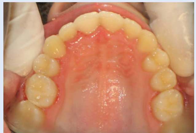
Slika 4e. Skinuta fiksna ortodonska naprava – oralni snimak Figure 4e. Patient after removal of fixed orthodontic appliance – occlusal view