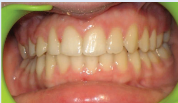
Slika 4c. Skinuta fiksna ortodonska naprava – prednji snimak Figure 4c. Patient after removal of fixed orthodontic appliance – frontal view