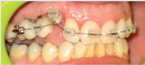
Slika 6a. Postavljena fiksna ortodonska naprava – bočni snimak Figure 6a. Fixed appliance – lateral view