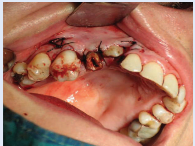
Slika 5. Stanje nakon završene operacije apikalno pomaknutog režnja s prikazivanjem krune očnjaka Figure 5. Frontal view following apically repositioned flap with exposition of tooth crown