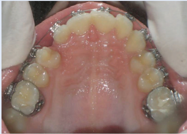
Slika 4b. Postavljena fiksna ortodonska naprava – oralni snimak Figure 4b. Fixed orthodontic appliance – occlusal view