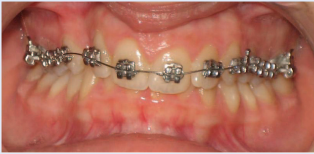
Slika 4a. Postavljena fiksna ortodonska naprava – prednji snimak Figure 4a. Fixed orthodontic appliance – frontal view