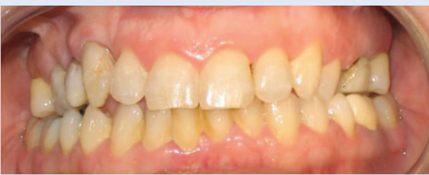
Slika 6c. Skinuta fiksna ortodonska naprava – prednji snimak Figure 6c. Condition after removal of fixed appliance – frontal view