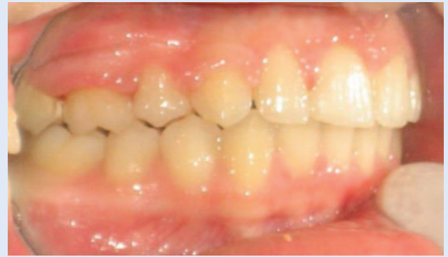
Slika 4d. Skinuta fiksna ortodonska naprava – bočni snimak Figure 4d. Patient after removal of fixed orthodontic appliance – lateral view