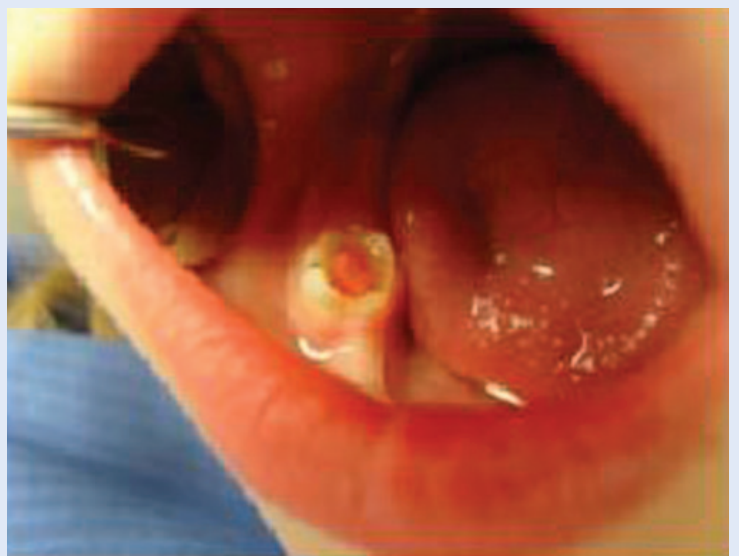
Slika 3. Polip pulpe na mliječnom kutnjaku Figure 3. Dental pulp polip on primary molar

zivnog tkiva, izgledom crvenkaste boje i oblika cvjetače). Ponekad se pojavljuju simptomi ireverzibilnog pulpitisa, poput spontanog i dugotrajnog bola na hladno i toplo, a često boli i tijekom žvakanja, zbog mehaničkog podraživanja tkiva. Za zube s hiperplastičnim pulpitisom indicirana je endodontska terapija (pulpotomija ili pulpektomija) ili ekstrakcija 10,11 .