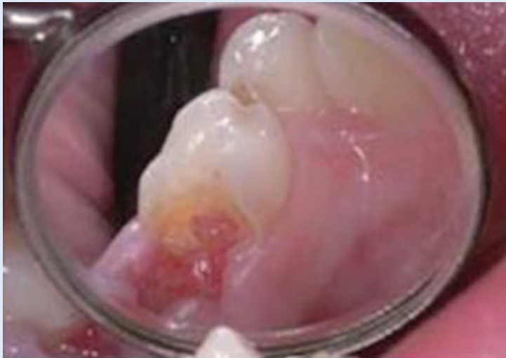
Slika 4. Ekspozirana pulpa mliječnog kutnjaka Figure 4. Dental pulp exposure on primary molar

Nekroza pulpe kliničko je stanje gdje i subjektivni i objektivni nalazi govore u prilog odumiranja pulpe. Pulpa je okružena tvrdim zubnim tkivom i nema kolateralne cirkulacije, a venska i limfna cirkulacija mogu kolabirati pod povećanim intrapulpnim tlakom, što dovodi do likvefakcijske nekroze. Osim likvefakcijske nekroze, može nastati i ishemična nekroza, kao posljedica traumatskih povreda i poremećene ili sasvim prekinute cirkulacije. Nekroza pulpe obično je asimptomatska, ali može biti popraćena epizodama spontanog bola i nelagode na pritisak. Zub ne reagira na termičke podražaje i električni test vitaliteta. Jedini simptom nekroze može biti veća ili manja diskoloracija krune zuba.