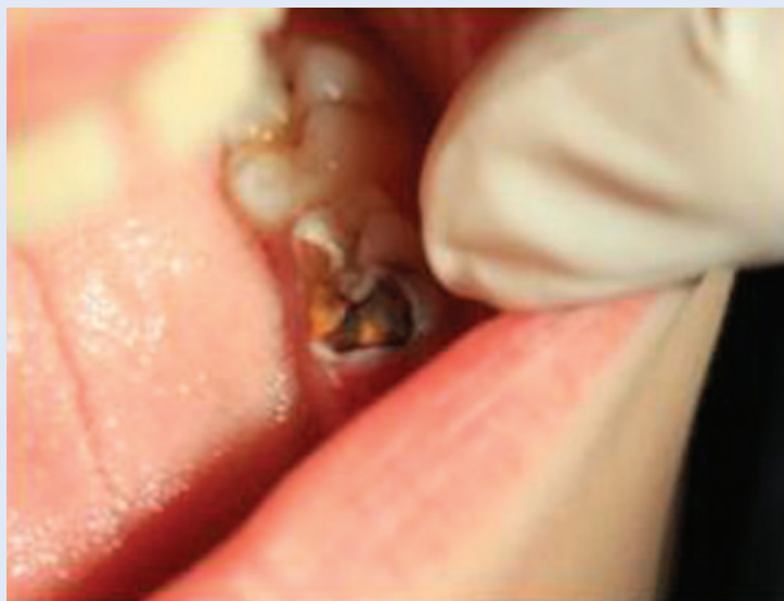
Slika 1. Karijes na mliječnom kutnjaku Figure 1. Decay on primary molar

Zbog toga je terapijski pristup liječenju mliječnih zuba specifičan. Općenito se smatra da pulpa mliječnih zuba ima visok potencijal cijeljenja, što se objašnjava visokom staničnom aktivnošću i vrlo dobrom vaskularizacijom pulpnog tkiva. Osnovni princip liječenja zubne pulpe jest očuvanje vitaliteta pulpe, te primjena metoda koje omogućuju