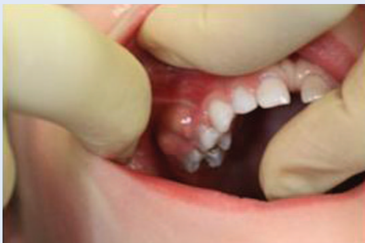
Slika 5. Fistula Figure 5. Fistula

Moguća je čitava ljestvica upalnog odgovora u rasponu od reverzibilnog pulpitisa do nekroze kod višekorijenskih zuba, što može dovesti do zabune kod interpretacije testova vitaliteta. Osim toga, učinci nekroze rijetko su ograničeni samo na korijenski kanal. Zbog širenja upalne reakcije na periapikalno tkivo, zubi s nekrotičnom pulpom često su osjetljivi na perkusiju. Za zube s nekrozom pulpe indicirana je endodontska terapija ili ekstrakcija 1,10 .