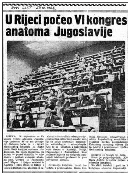
Slika 9. Članak u dnevnom tisku o VI. kongresu anatoma Jugoslavije održanom u Rijeci 1962. godine.

Pedagoško i didaktičko iskustvo u nastavi anatomije prof. Križan je prenio na svoje suradnike odnosno nasljednike na Zavodu za anatomiju. Time je održan kontinuitet u kvalitetnom radu Zavoda više od pola stoljeća, što se drugim riječima može nazvati Križanova riječka škola anatomije .