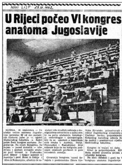
Slika 9. Članak u dnevnom tisku o VI. kongresu anatoma Jugoslavije održanom u Rijeci 1962. godine.