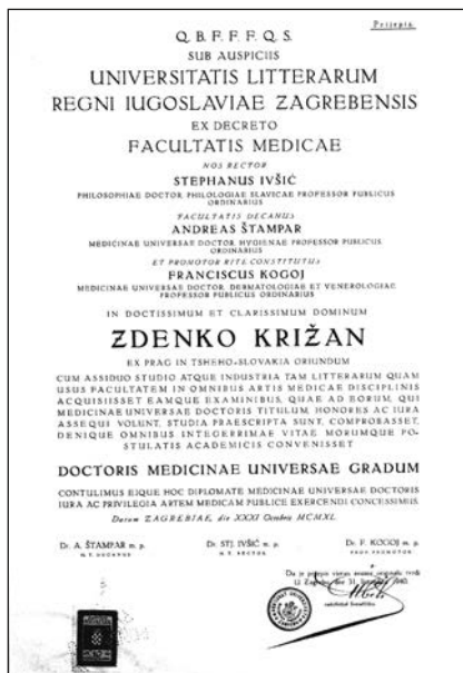
Slika 4. Prijepis diplome o stečenoj tituli doktor medicine.