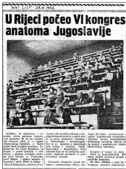
Slika 9. Članak u dnevnom tisku o VI. kongresu anatomata Jugoslavije održanom u Rijeci 1962. godine.