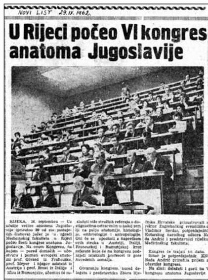
Slika 9. Članak u dnevnom tisku o VI. kongresu anatoma Jugoslavije održanom u Rijeci 1962. godine.