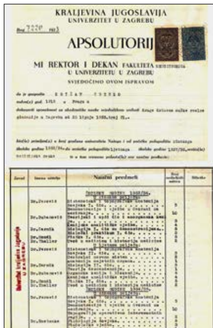
Slika 3. Prva stranica apsolutorija Zdenka Križana.

U listopadu 1944. godine docent Križan imenovan je odlukom Poglavnika Nezavisne Države Hrvatske izvanrednim sveučilišnim profesorom anatomije, a u veljači 1945. godine redovnim profesorom pri Katedri za anatomiju Medicinskog fakulteta u Sarajevu, Hrvatskog Sveučilišta u Zagrebu [4,5]. Ondje je vodio nastavu iz anatomije u zimskom semestru akademske godine 1944./45., odnosno do oslobođenja Sarajeva 6. travnja 1945. kada je prestala nastava na Medicinskom fakultetu u Sarajevu. Akademsko napredovanje do redovnog sveučilišnog profesora u razdoblju od travnja 1944. do veljače 1945., uz činjenicu da je prvi znanstveni rad objavio 1945. godine, pokazuju prirodu motiva