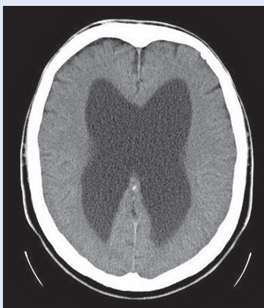
Slika 1. CT slika: Proširen ventrikularni sustav – hidrocefalus

U moždanom parenhimu nalazi se ventrikularni sustav, koji komunicira sa subarahnoidnim prostorom kranijuma, kao i centralnim kanalom u