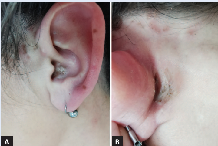
Slika 2. Periaurikularne i aurikularne lezije šest mjeseci nakon pojave A) Otvoreni komedoni lokalizirani su u konhi lijeve uške. B) Atrofični ožiljak s pokojim komedonom lokaliziran je u retroaurikularnoj brazdi lijevoga uha.

Zlatnim standardom za postavljanje dijagnoze komedonalnog lupusa smatra se biopsija i patohistološka analiza promijenjene kože, koja pokazuje dilatirane folikule s keratinskim čepovima i periadneksalni limfocitni infiltrat. Direktna imunofluorescentna analiza otkriva depozite imunoglobulina duž dermoepidermalne granice, a serološki testovi često pokazuju povišen titar ANA antitijela.