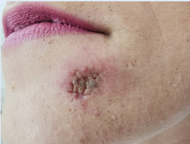
Slika 1. Eritematozna infiltracija s atrofičnim ožiljcima i sivkasto-smeđim otvorenim komedonima lokalizirana na lijevoj strani brade, šest mjeseci nakon pojave