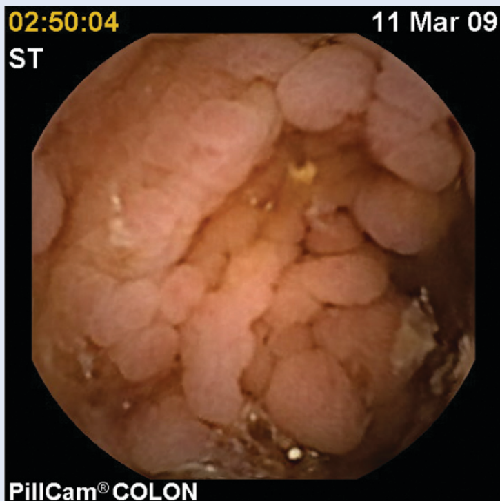
Slika 4. Multipli polipi kolona – familijarna adenomatozna polipoza – FAP Figure 4. Multiple colon polyps – Familial adenomatous polyposis – FAP

Jedno od najvećih ispitivanja provedeno je u osam europskih centara 8 i obuhvatilo je 320 bolesnika. Utvrđena je osjetljivost VCE od 72 % (95 % CI 68 – 75 %), a specifičnost od 78 % (95 % CI 71 – 84 %). Zaključak je autora da je pregled kolona moguć kapsulom, ali da je osjetljivost niža od kolonoskopije.