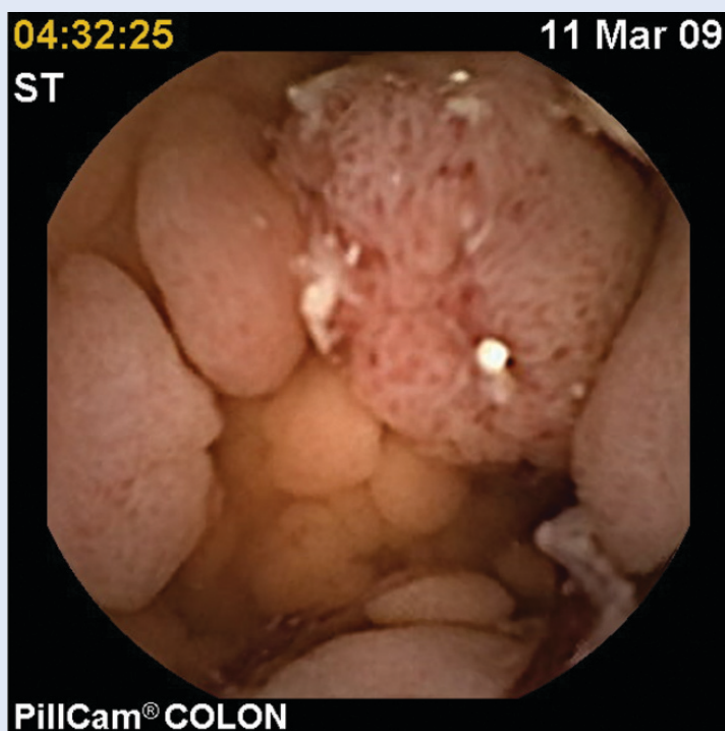
Slika 3. Multipli polipi kolona – familijarna adenomatозна polipoza – FAP Figure 3. Multiple colon polyps – Familial adenomatous polyposis – FAP