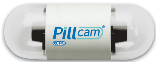
Slika 1. PillCam Colon kapsula

Tijekom 2006. započelo se s primjenom kapsule za pregled debelog crijeva (PillCam Colon).