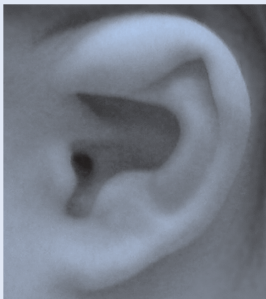
Slika 1. Primjer minor anomalije – zadebljali heliks Figure 1. Example of minor anomaly – thickened helix

Velika važnost minor anomalija leži u činjenici da u 90 % sve novorođene djece koja imaju 3 ili više minor anomalija postoji i major anomalija, pa tako zapravo minor anomalije upućuju na moguću prisutnost major anomalija 20 . Rizik pojave major anomalija povećava se s brojem minor ano-