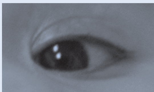
Slika 3. Primjer minor anomalije – epikantus Figure 3. Example of minor anomaly – epicanthic fold