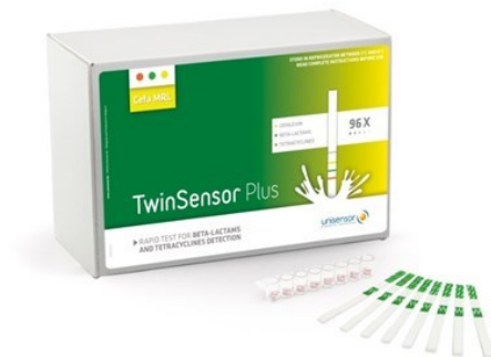
Slika 1. TwinSensor Plus KIT106. Izvor: Unisensor [Internet]. Dostupno na: https://unisensor.be/assets/326dc684-439f-43fd-aeef-a7e6165459e0/kit106-twinsensor-plus.pdf [pristupljeno 02.09.2024.].