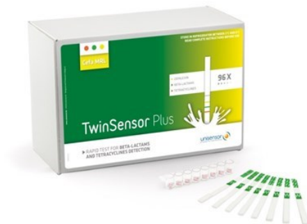
Slika 1. TwinSensor Plus KIT106.