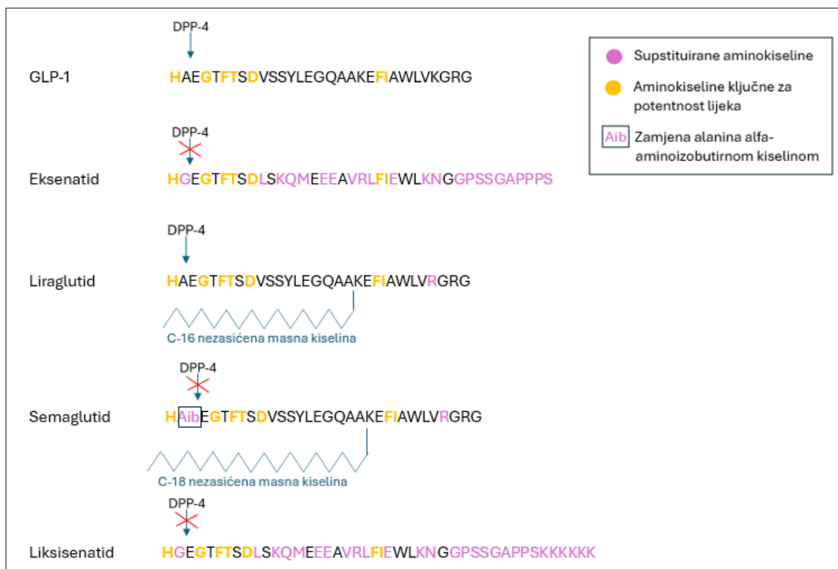
Slika 3. Shematski prikaz molekularne strukture nekih od agonista GLP-1 receptora i usporedba sa strukturom GLP-1 molekule.