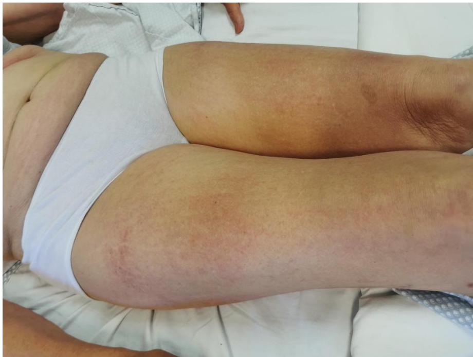
Slika 4. Dermografizam i flagelatni eritem na natkoljenicama pacijentice s dermatomiozitisom

Kožni osip kod dermatomiozitisa često izaziva značajan svrbež, što može olakšati razlikovanje fotoegzacerbiranog osipa dermatomiozitisa od osipa sistemskog eritematoznog lupusa, koji obično nije praćen svrbežom. (19) Flagelatni eritem rijedak je oblik osipa koji je karakteriziran linearnim eritematoznim makulama na leđima koje spontano nestaju tijekom nekoliko tjedana. (41) Klinička prezentacija bolesti može uključivati i dermografizam koji podrazumijeva linearne urtike kao odgovor na grebanje ili pritisak kože. (42) (Slika 4). Dermatomiozitis je često karakteriziran promjenama na noktima koje uključuju periungvalni eritem i teleangiektazije, distrofiju kutikule te hemoragične infarkte kože nokta (Slika 5).