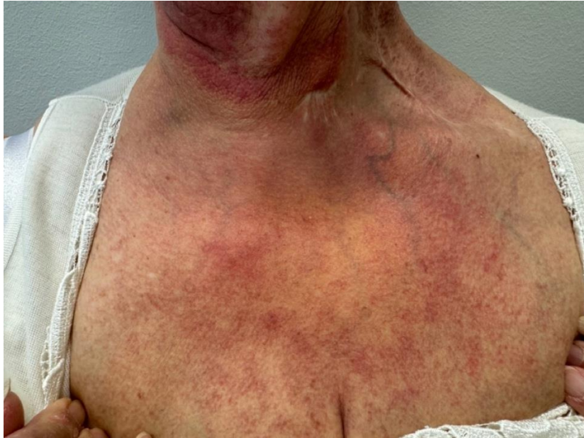
Slika 2. Fotosenzitivni eritem prednje strane vrata i prsa (“V znak”, engl. V-sign)