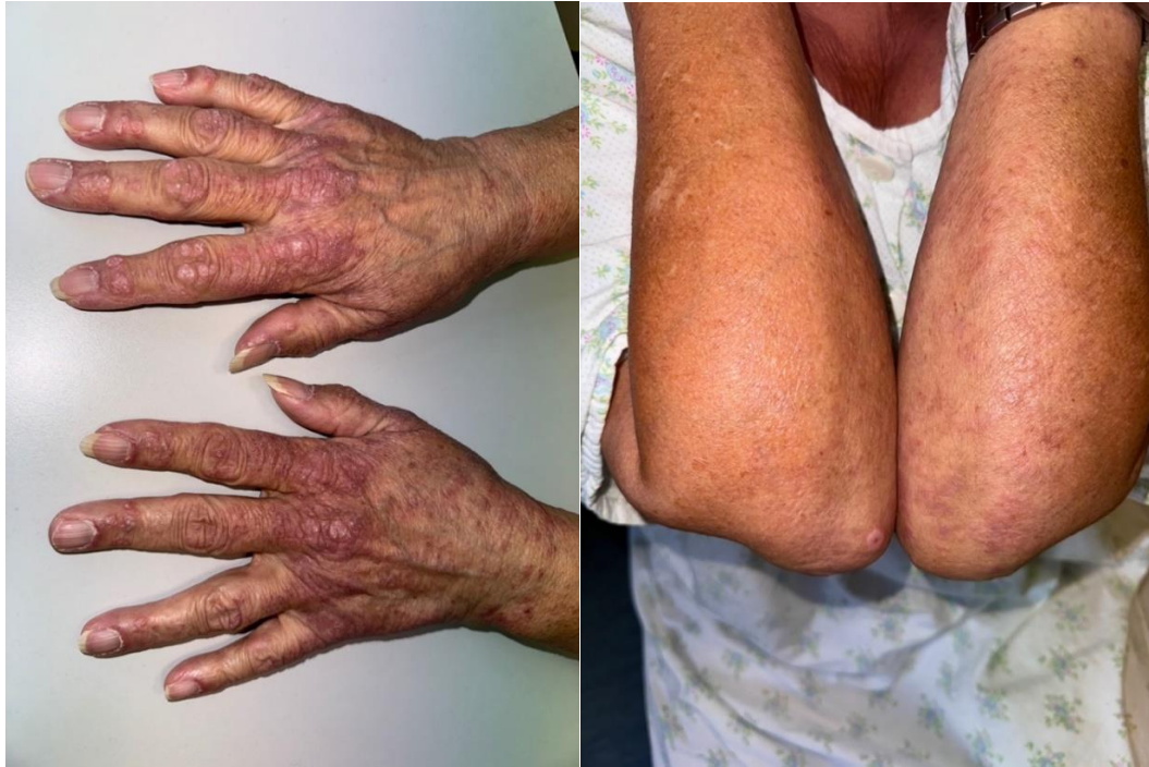
Slika 1. Gottronove papule iznad metakarpofalangealnih, interfalangealnih zglobova te na dorzalnoj strani podlaktica i laktova