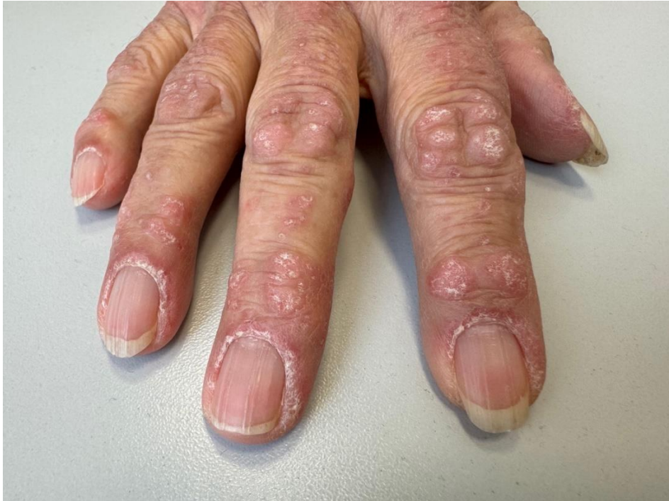
Slika 5. Promjene na noktima kod pacijentice s dermatomiozitisom