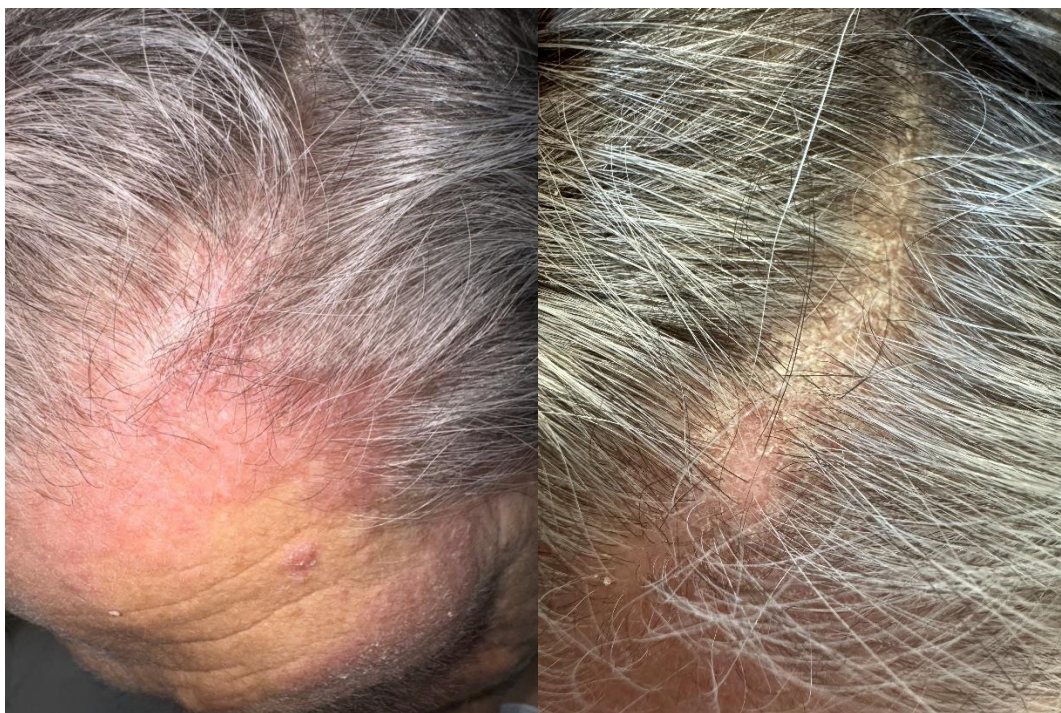
Slika 6. Ljuskavi eritematozni plakovi na vlasištu