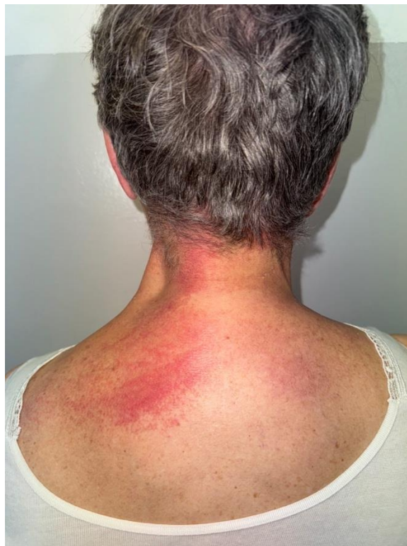
Slika 3. Eritem zatiljka (“znak marame”, engl. shawl sign)