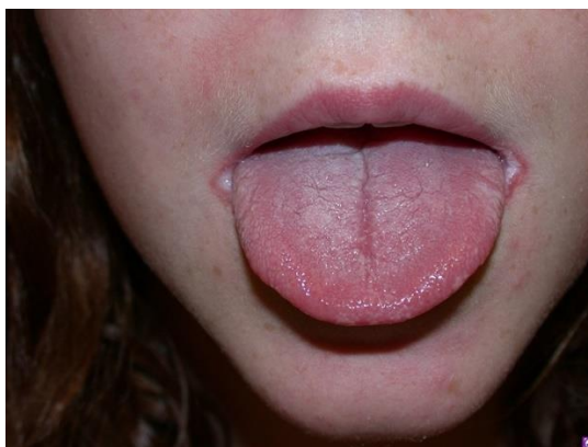
Slika 2: Prikaz pacijenta sa angularnim heilitisom. (23)