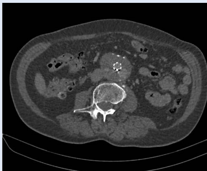
Slika 3. CT aortografija, sagitalni presjek – endoleak tipa II

Operacije aneurizme abdominalne aorte nakon nezadovoljavajućeg rezultata EVAR-a prati veći broj komplikacija – zbog atrofije zida aorte, periaortalne upale i fibroze te otežanog postizanja proksimalne i distalne vaskularne kontrole zbog pozicije stent-grafta, što često zahtijeva suprarenalno klemanje.