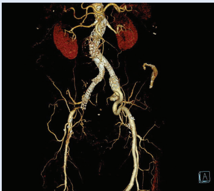
Slika 4. VRT rekonstrukcija – okluzija desnog kraka EVAR-a

dok tip V označava rast aneurizmske vreće bez detektabilnog protoka u aneurizmi raznim tehnikama oslikavanja (endotenzija) 4 . Praćenjem bolesnika dominantno nalazimo endoleak tipa II, koji predstavlja retrogradno punjenje aneurizmske vreće visceralnim i lumbalnim ograncima, dok u kirurške opcije ubrajamo sakotomiju i ligaciju lumbarnih i/ili donje mezenterične arterije 1 . Endoleak tipa II u naravi je „benigni“ tip, ali je povezan s kasnim porastom aneurizmske vreće, stoga je praćenje bolesnika ključno 1,32 . Liječi se primarno minimalno invazivnim metodama, u koje ubrajamo translumbalnu ili transkavalnu punkciju i aplikaciju okluzivnog tekućeg sredstva u aneurizmsku vreću ili endovaskularnu embolizaciju donje mezenterične arterije, ako je došlo do progresije rasta aneurizme 33,34 . Okluzija donje mezenterične arterije nosi rizik od ishemije kolona 4 . Endoleak tipa I najčešći je uzrok sekundarne rupture. Razvoj novih endovaskularnih stent-graftova i tehnika, kao što su fenestrirani i razgranati ( branched ) endograftovi, smanjilo je potrebu za sekundarnim kirurškim intervencijama, ali važno je napomenuti da plasiranje dodatnih endograftova može dodati kompleksnosti kasnijem sekundarnom kirurškom zbrinjavanju 1 . Kod tipova III, IV i V, kada se prati porast aneurizmske vreće, najčešće je potrebna kirurška konverzija 1,4 .