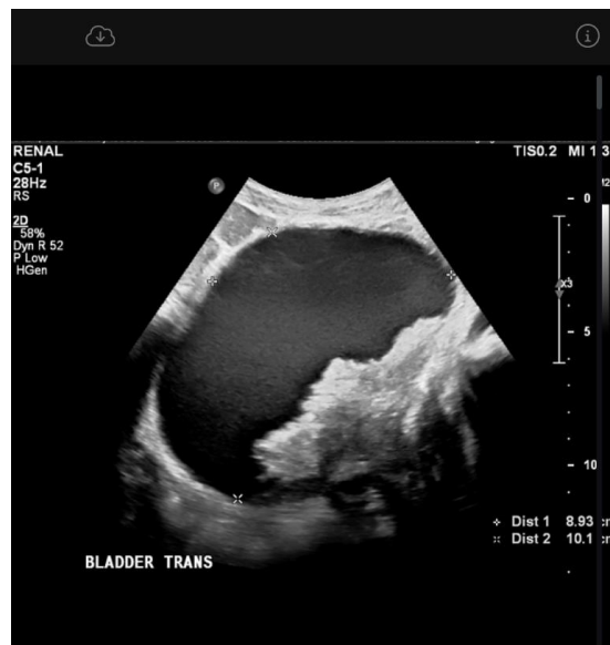
Slika 1 Ultrazvučni prikaz karcinoma mokraćnog mjehura. (8)

su neki krajevi, poput suptropskog i tropskog pojasa, naseljeni metiljem Shistosomom koja je jedan od etioloških čimbenika nastanka. Također, potrebno je pažnju posvetiti socijalnoj anamnezi. Vrsta rada i rad s anilinskim bojama smatramo uzročnikom karcinoma mokraćnog mjehura. U fizikalnom statusu potrebno je dodatno palpirati mokraćni mjehur i uključiti ultrazvuk bubrega i mokraćnog mjehura. Prije daljnje dijagnostike potrebno je učiniti laboratorijski pregled sedimentacije urina i citološki pregled istog. (2) Zlatni standard dijagnostike tumora mokraćnog mjehura je cistoskopija te nakon nje transuretralna resekcija prilikom koje se uzima suspektna promjena za patohistološku analizu. U nekih bolesnika indicirana je magnetska rezonanca (MR) ili kompjuterska tomografija (CT) za evaluaciju proširenosti bolesti. Na sljedećim slikama prikazane su radiološke metode dijagnostike tumora mokraćnog mjehura (slika 1 i 2).