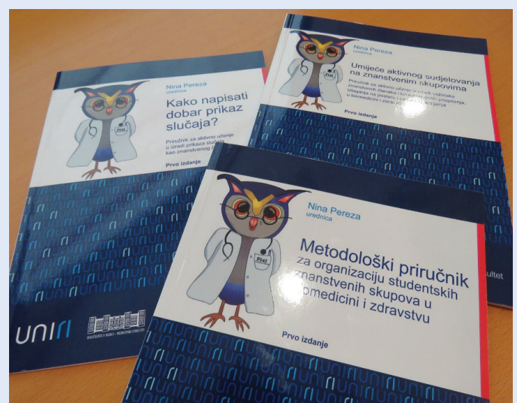
Slika 6. Priručnici Studentske sekcije

pretvoren u izborni kolegij na petoj godini sveučilišnog integriranog prijediplomskog i diplomskog studija Medicina na Medicinskom fakultetu u Rijeci. Radionicu i izborni kolegij prate dva priručnika – Metodološki priručnik za organizaciju studentskih znanstvenih skupova u biomedicini i zdravstvu te Umijeće aktivnog sudjelovanja na