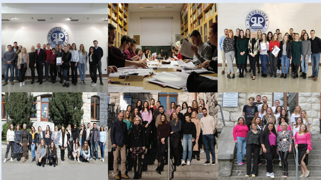
Slika 4. Šest radionica Kako napisati dobar prikaz slučaja od 2017. do 2023. godine