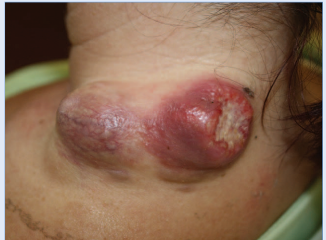
Slika 2. U V. regiji lijeve strane vrata nalaze se dvije okrugle tvorbe pojedinačne veličine oko 3 cm u promjeru, tvrđe konzistencije, nefiksirane za podlogu, bezbolne na palpaciju, prekrivene hiperemičnom kožom. Stražnja tvorba djelomično je egzulcerirana.