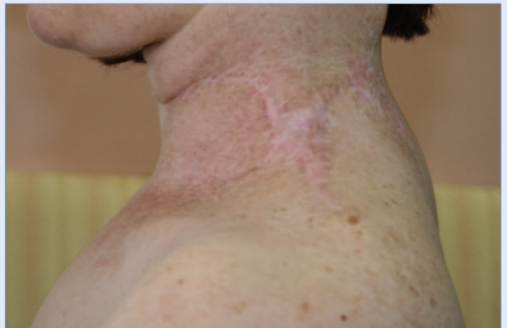
Slika 5. Uredan poslijeoperacijski lokoregionalni nalaz.

preparatu se obično uvijek nađu područja benignog spiradenoma. Diferencijalno dijagnostički važno je razlikovati benigni od malignog ekrinog spiradenoma. Imunohistokemijski spiradenokarcinom pozitivan je na većinu citokeratina, CEA, EMA, S100, pokazuje pojačanu ekspresiju p53 gena 6 . U malignom tumoru zabilježene su TP53 mutacije, dok nisu prisutne kod benignog spiradenoma.