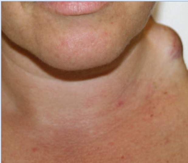
Slika 1. Na lijevoj strani vrata vide se dvije kuglaste promjene (prisutne ovdje unatrag 25 godina) koje se povećavaju te pacijentici stvaraju prvenstveno estetski problem.