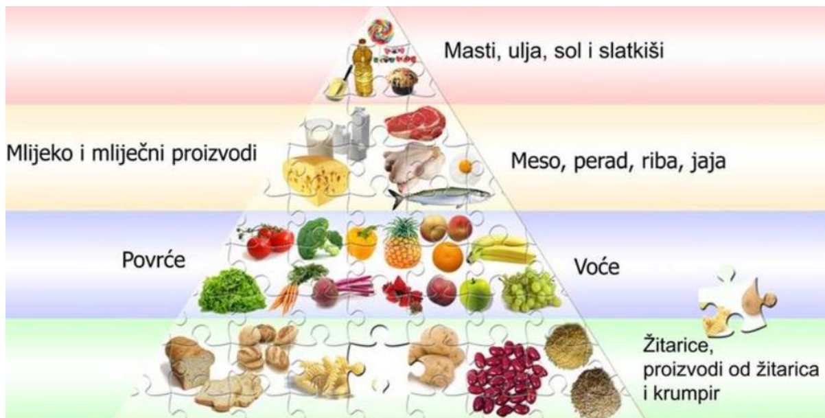
Slika 1. Hrvatska prehrambena piramida. (Ministarstvo zdravstva u suradnji s Ministarstvom obrazovanja, Hrvatskim zavodom za javno zdravstvo i kliničkim bolnicama, 2002.)

Često se za prikaz pravilne prehrane koristi takozvana piramida pravilne prehrane koja zorno prikazuje važnost pojedinih namirnica u svakodnevnoj prehrani. Sastoji se od 4 skupine namirnica podijeljenih u 4 razine. Na dnu piramide, ali od najveće važnosti nalaze se žitarice i proizvodi nastali iz njih koji čine temelj obrasca pravilne prehrane. Potom slijedi skupina voća i povrća koje je bitno kao izvor minerala i vitamina. Nakon navedenih skupina slijede bjelančevine odnosno proteini, a na samom vrhu što upućuje na njihovu minimalnu konzumaciju nalaze se masti i šećeri te visoko-prerađena hrana bogata njima (Slika 1).