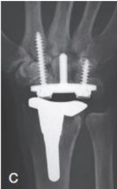
Slika 4. Universal 2 endoproteza

Suvremene endoproteze ručnog zgloba spadaju u 4. generaciju, a prvi predstavnik je endoproteza Universal 2 koja može biti cementna ili bezcementna za razliku od prošlih generacija endoproteza gdje su sve bile samo cementne (36) [Slika 4.].