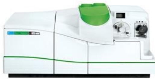
Slika 4. ICP-MS NexION 300X (Perkin Elmer Instruments, Waltham, MA, SAD) (50.)

Metoda induktivno spregnute plazme uz spektroskopiju masa (ICP-MS) je analitička tehnika koja se primjenjuje kako bi se odredili elementi u niskim koncentracijama u biološkom uzorku. Biološki uzorak koji se analizira u ICP-MS-u mora biti razrijeđen ili termički razgrađen. ICP-MS tehnika induktivno spregnutu plazmu koristi kao ionizacijski izvor, a elemente detektira pomoću masenog spektrometra (49). Uzorak se atomizira i ionizira djelovanjem visoke temperature plazme prilikom čega se ioni razdvajaju. Ioni se odvajaju na temelju odnosa mase i naboja ( m/z ), koji na kraju čine maseni spektar. Za dobivanje podataka koji su prikazani u ovom diplomskom radu svi esencijalni elementi iz kose su analizirani induktivno spregnutom plazmom uz spektroskopiju masa (ICP-MS - NexION 300X Perkin Elmer Instruments, Waltham, MA, SAD). Masene frakcije su determinirane pomoću vanjskih standarada, dok je koeficijent linearnosti za kalibracijske krivulje R^2 > 0,999 korišten za izračunavanje dobivenih koncentracija elemenata.