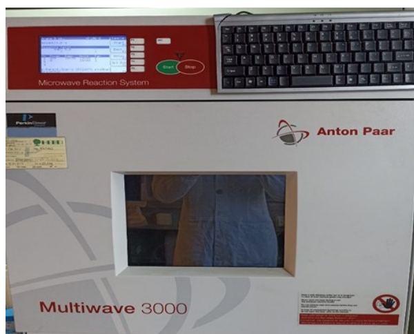
Slika 2. Mikrovalna digestivna peć (Perkin Elmer Multiwave 3000), SAD).