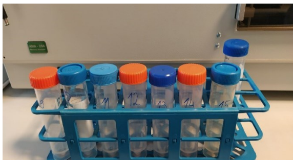
Slika 3. Otopina uzoraka razorene kose volumena 25 mL