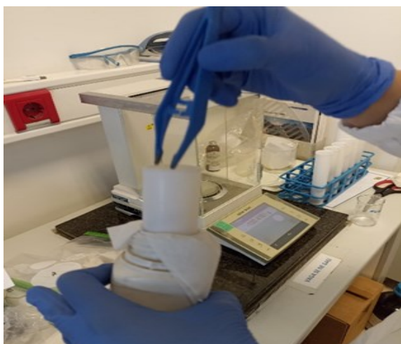
Slika 1. Priprema uzorka kose za vaganje

Uzorci kose prikupljeni su upotrebom keramičkih škara. Uzorak je uzet s okcipitalnog dijela glave, u pramenovima duljine 1-3 cm od tjemena glave te u količini od oko 1 g kose. Uzorci su pohranjeni u PVC vrećicu, pravilno označeni te transportirani u laboratorij na pripremu za daljnju analizu. Analiza uzoraka kose provela se u Nastavnom zavodu za javno zdravstvo Primorsko-goranske županije na Odjelu za Zdravstvenu ekologiju. Prije obrade uzoraka pramenovi kose su očišćeni acetonom, nakon čega su se vagali u odgovarajućim epruvetama. Za potrebe analize izvagalo se 0,5 g kose na analitičkoj vagi (Mettler Toledo) (Slika 1). Nakon odvage uzorka, uzorcima je dodano 5 mL HNO 3 (65%), 1 mL HCl (37%) visoke čistoće i 4 mL H 2 O 2 (30%). Tako pripremljeni uzorci kose razarali su se u mikrovalnoj digestivnoj peći (Perkin Elmer Multiwave 3000, SAD ) tijekom 1 h (Slika 2). Razoreni sadržaj uzoraka kose prebačen je u epruvete s čepom te je sadržaj nadopunjen destiliranom vodom do 25 mL (Slika 3). Tako pripremljeni uzorci su se koristili za daljnje određivanje metala.