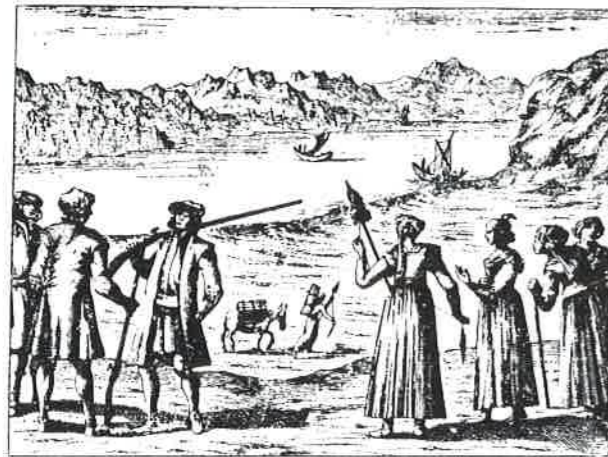
Slika 4. Riječani prema Valvasoru, 17. st.