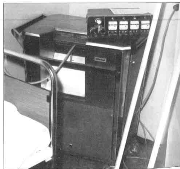
Slika 6. Curietron – uređaj s radioaktivnim cezijem (Cs-137) za afterloading-metodu zračenja ginekoloških malignoma u Rijeci od 1974. godine.

Tako je Onkološki zavod bio promotor, a pojedine klinike i zavodi suorganizatori modernog onkološkoga tretmana bolesnika. 15,16