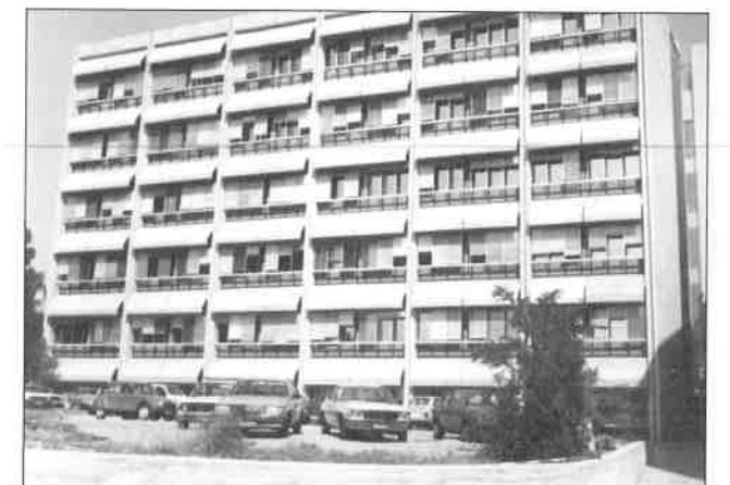
Slika 4. Na prvom katu Ginekologije smješten je 1985. novi dio Zavoda za radioterapiju i onkologiju KBC-a Rijeka.