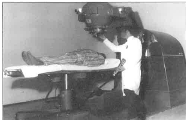
Slika 5. Kobaltna bomba (theratron B) u Rijeci u uporabi od 1965. do 2000. godine.

tar za ginekološki malignom u Petrovoj ulici u Zagrebu, jedini centar u kojem se ginekološki malignomi sustavno liječe i radijem 10 (slika 6).