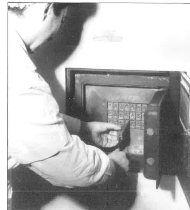
Slika 1. Olovni sef s pretincima za pohranu radija iz 1934. godine u Zavodu za radioterapiju i onkologiju KBC-a Rijeka.