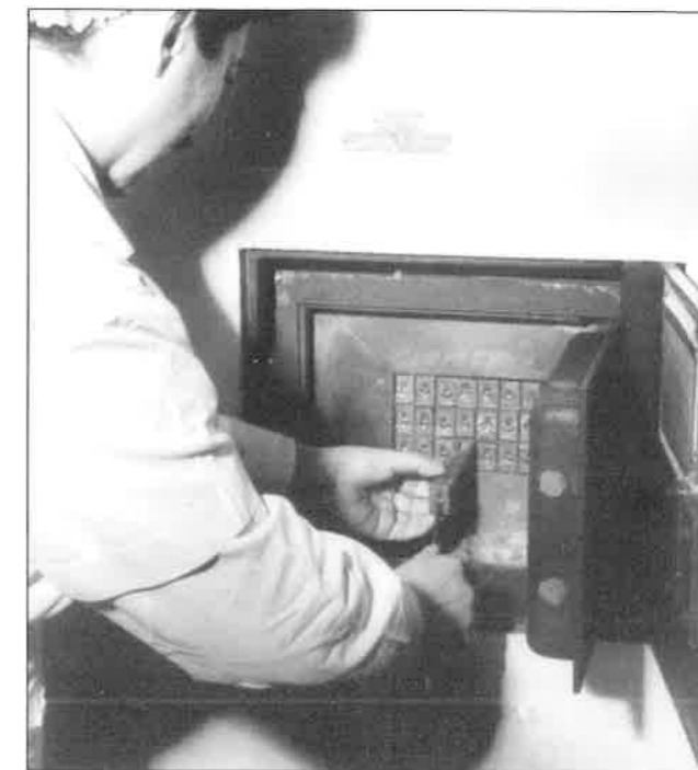
Slika 1. Olovni sef s pretincima za pohranu radija iz 1934. godine u Zavodu za radioterapiju i onkologiju KBC-a Rijeka.

Prema nekim zapisima dvadesetih godina radiološki odjel vodi dr. Lodovico Holtzabeck, koji 1923. godine uvodi rendgensko zračenje u terapiju tumora. Veoma agilan i zaokupljen tumorima, uspjeva zainteresirati i liječnički kolegij kao i savjet bolnice da 27. studenoga 1930. godine osnuju Onkološki dijagnostički centar. Taj će centar do konca rata djelovati kao ambulanta u kojoj će se besplatno pregledavati bolesnici iz Rijeke i okoline, za koje je postojala sumnja da boluju od malignog tumora. Centar je obavljao preglede i po pojedinim odjelima. Godine 1933. dobio je od Instituta Regina Elena iz Rima prvu količinu od 125 mg radija u obliku igala i tuba. S radijem je stigao i specijalni olovni sef koji je izradila Belge-Congo comp. , koja je proizvodila i radij u tadašnjoj belgijskoj koloniji Kongu. Debljina njegovih zidova i pretinaca za pohranu radij-igala i tuba je od 9 do 10 cm olova, što prema svim, pa i našim, novijim dozimetrijskim mjerenjima pruža potpunu zaštitu od zračenja. To je i jedini takav sef u našoj zemlji ( slika 1. ).